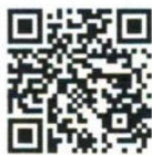
课程生成游戏—— 从主题活动到“汽车 4S店”游戏

游戏与幼儿园课程就好像血液和身体的关系,血液渗透在身体的每一个细小的部位,促进每一个部位机能的正常运行。当血液充足的时候,身体就表现出生命的活力,而当供血不足或血液出了毛病时,各个部位的机能也会受到影响,致使身体缺乏活力。因此,幼儿园课程与游戏必须进行有机整合,让游戏在激发儿童主动性和积极性的同时,最大限度地与教育因素融合在一起,帮助儿童建构一个系统的学习经验体系。