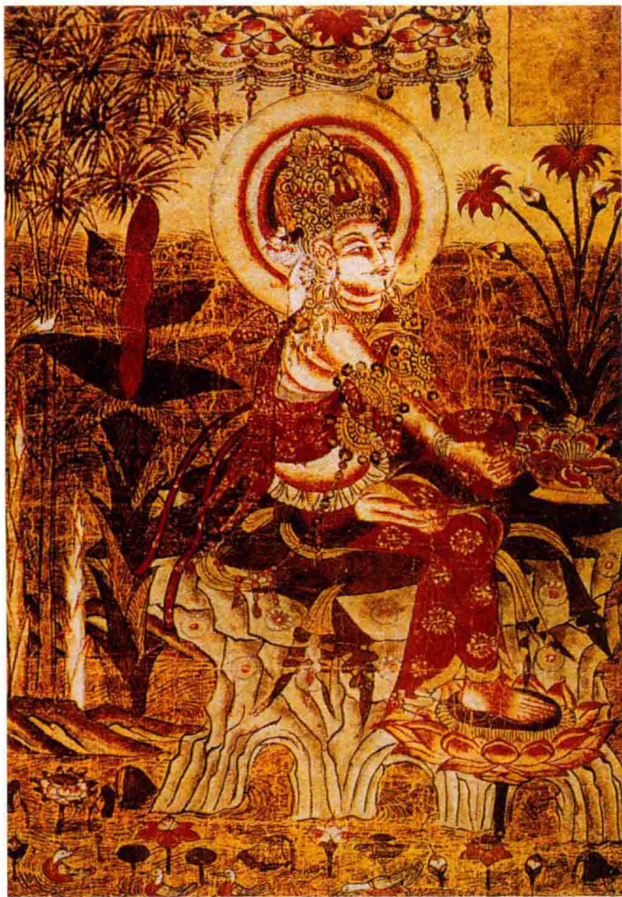
图1-3 唐代水月观音像

图右置放的盆花，花材有盛开的花朵，有含苞的花蕾，花型对称，有隆盛之美，为早期的盆花。