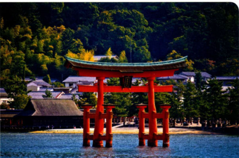
日本地标性建筑：宫岛的木制朱红色鸟居（译者注：鸟居是类似牌坊的日本神社附属建筑，代表神域的入口，用于区分神栖息的神域和人类居住的世俗界）