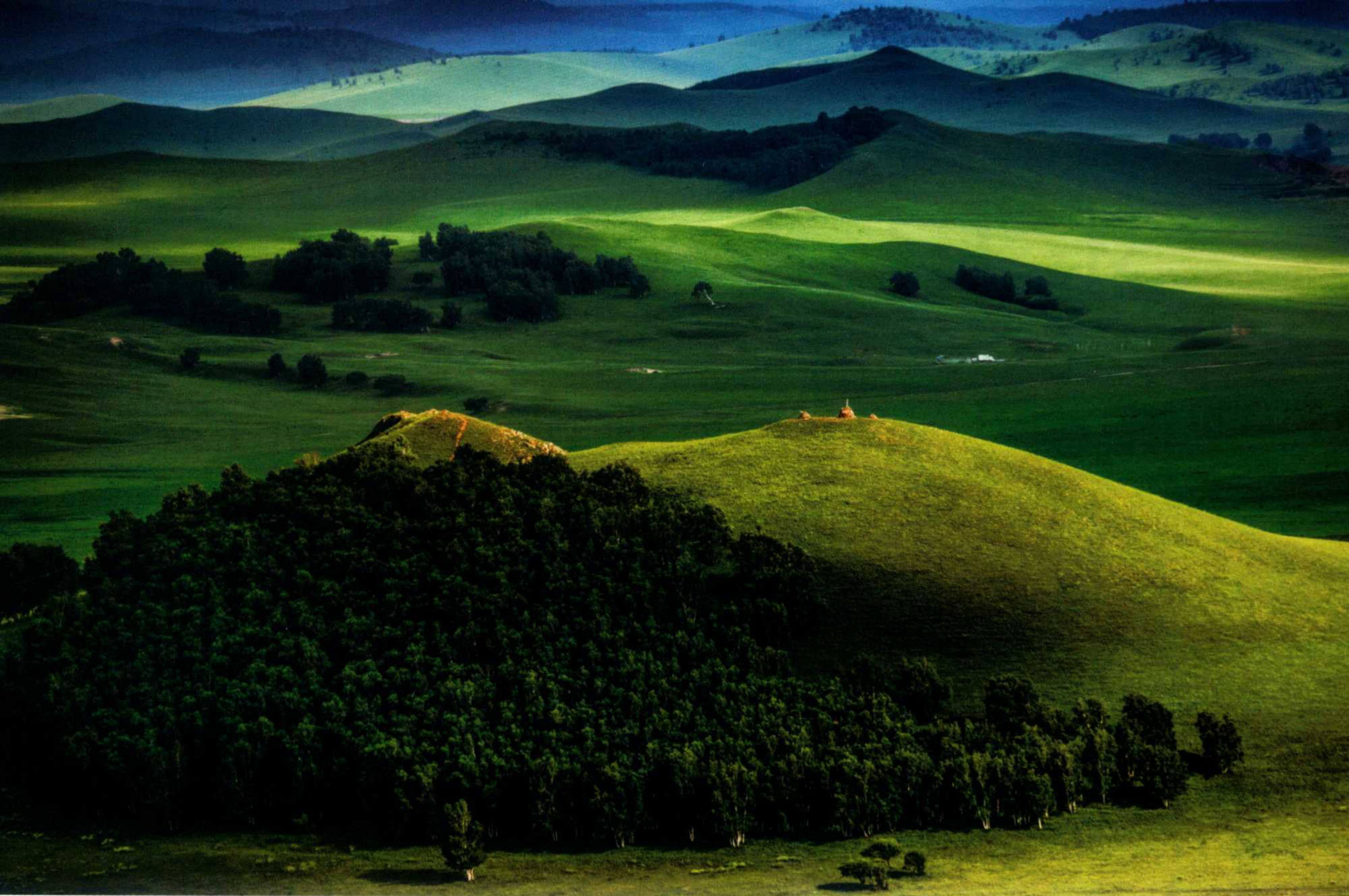
中国坝上光影 这张照片表现了大自然的光影灵动