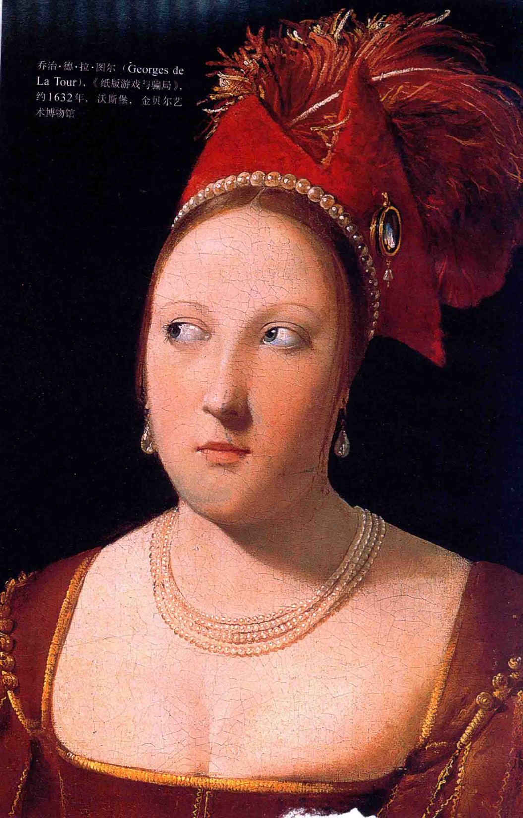
乔治·德·拉·图尔 (Georges de La Tour), 《纸版游戏与骗局》, 约1632年, 沃斯堡, 金贝尔艺术博物馆