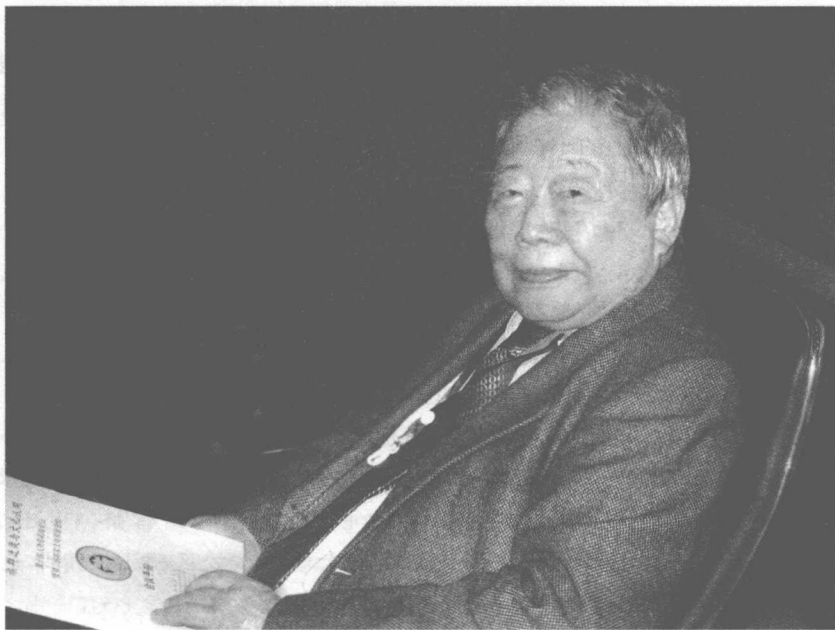
乔健先生（摄影 韦小鹏）

【编者按】2018年10月7日，著名人类学家、香港中文大学人类学讲座教授、人类学高级论坛顾问兼学术委员会主席乔健先生在台北驾鹤西去。为了缅怀这位人类学大师，11月3日上午，在第十七届人类学高级论坛开幕仪式后，举行了由人类学高级论坛秘书长、学术委员会主席团主席范可教授主持的“追念乔健先生的人生与学术”活动。