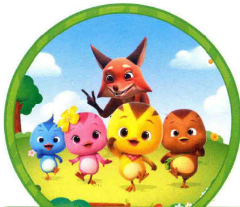
实现愿望的狐狸奶奶