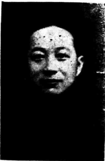
授 教 習 實 夫 實 趙