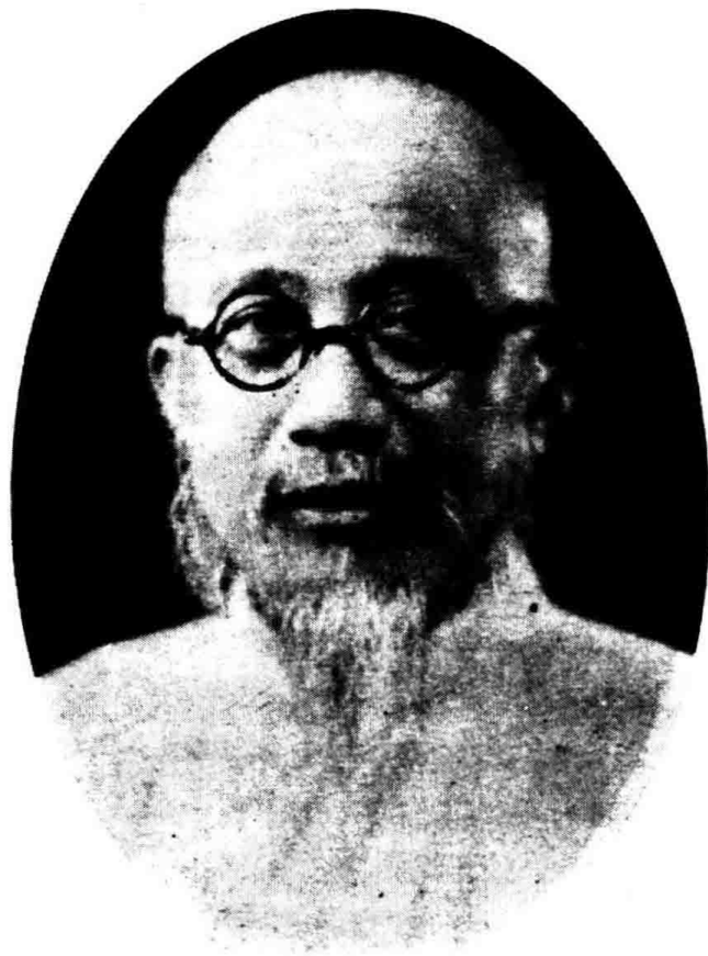
師講座講別特 恆 利 謝