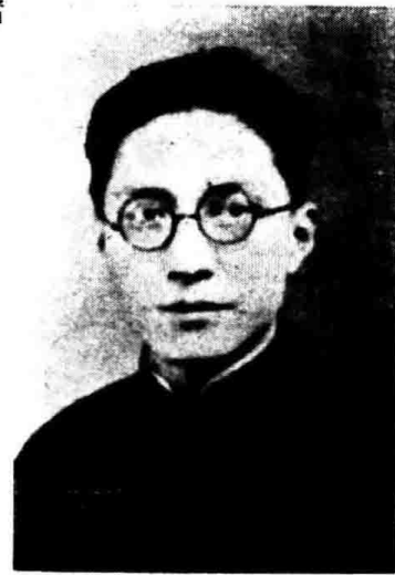
授 教 習 實 仁 濟 馬