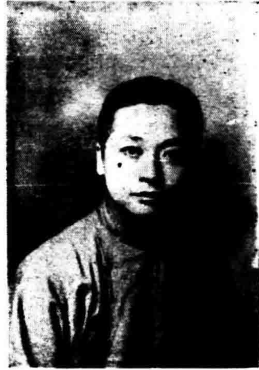
董 院 席 主 泉 鶴 朱