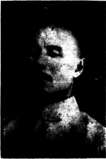
任 主 務 事 忠 寶 黃