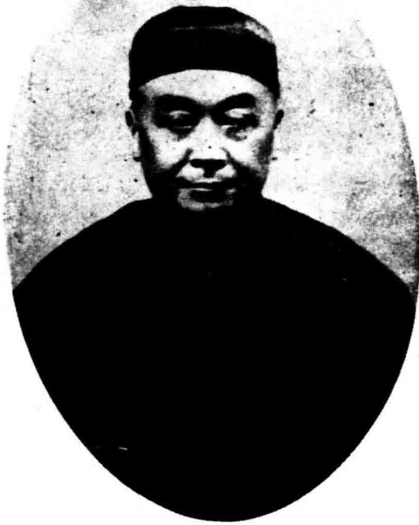
山 南 朱