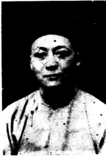
授 教 習 實 南 小 朱