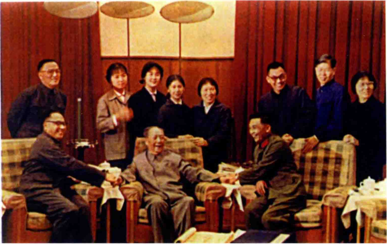
毛主席与医疗组成员合影,后排右三为皮肤科国家名老中医袁兆庄