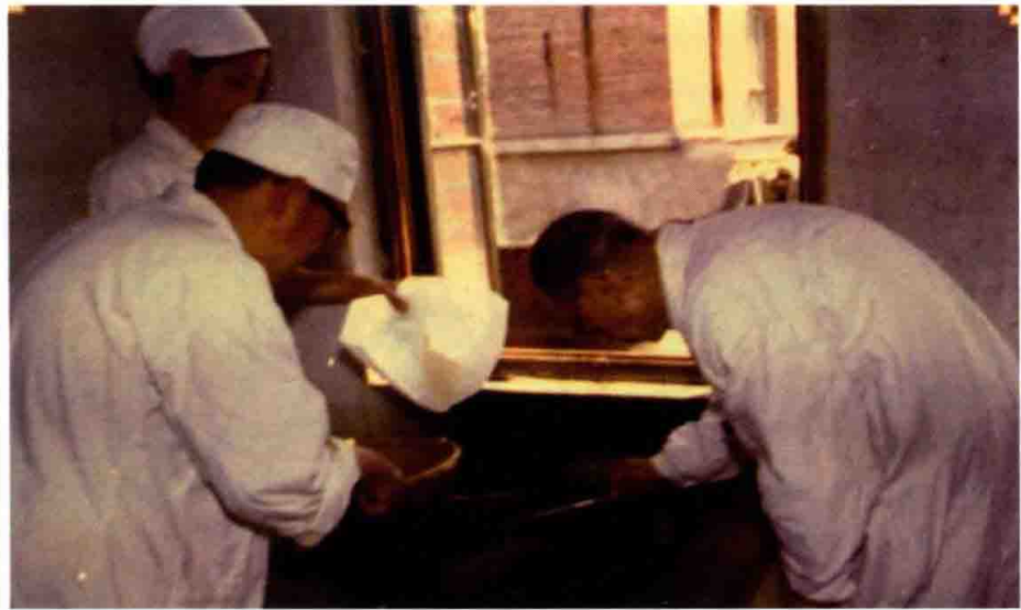
左图为毛主席 1958 年批示 右图为精诚大医赵炳南临方调配外用药