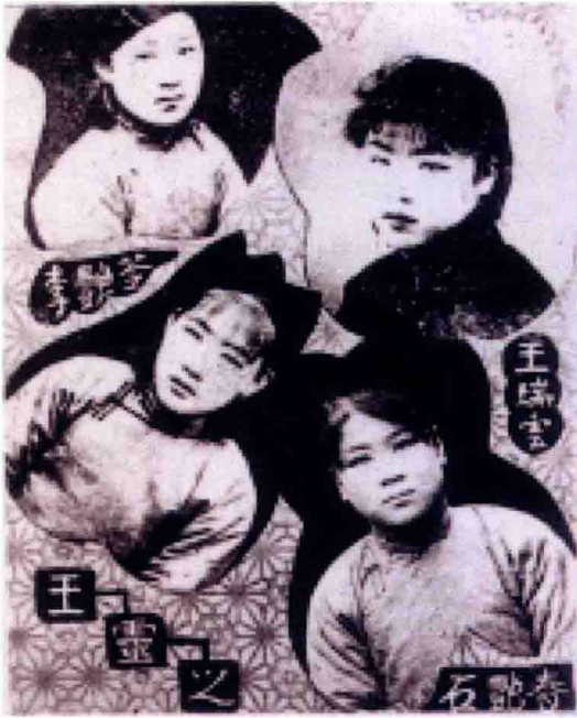
《济南大观》载山东大鼓演员