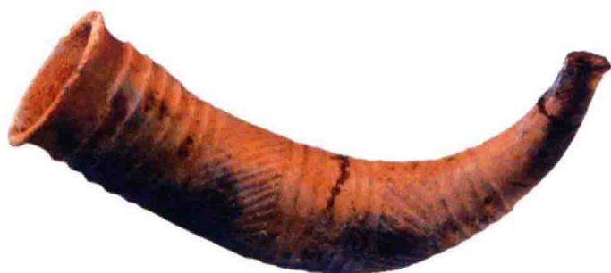
大汶口文化晚期的陶角