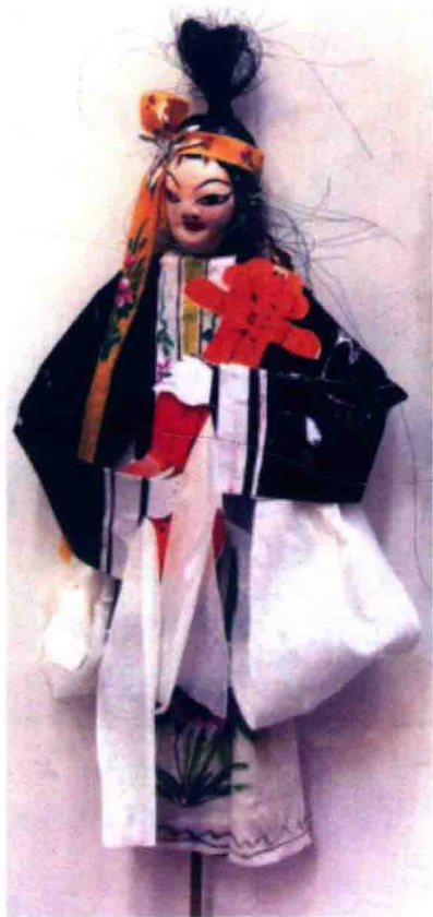
曹县戏曲人物纸扎