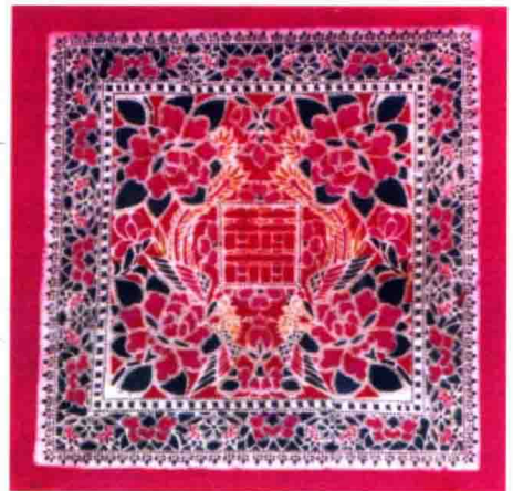
双喜牡丹（临沂市彩印包袱）