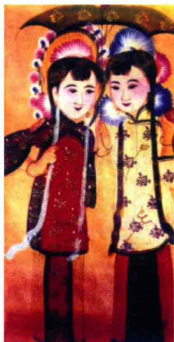
白蛇青蛇（高密市扑灰年画）