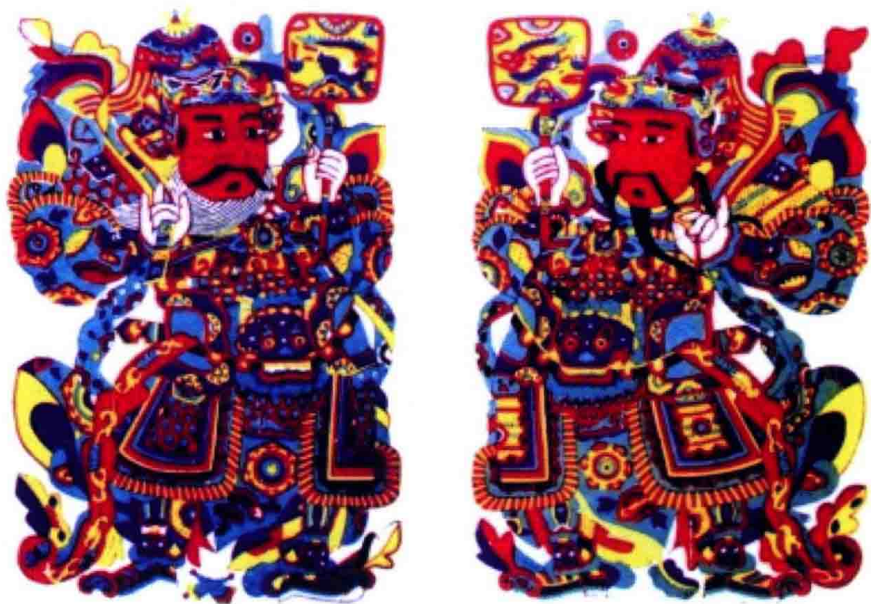
清·杨家埠武门神年画