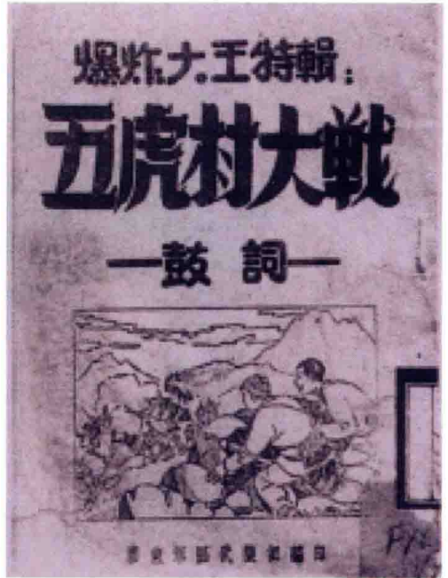
山东解放区出版的曲艺集封面