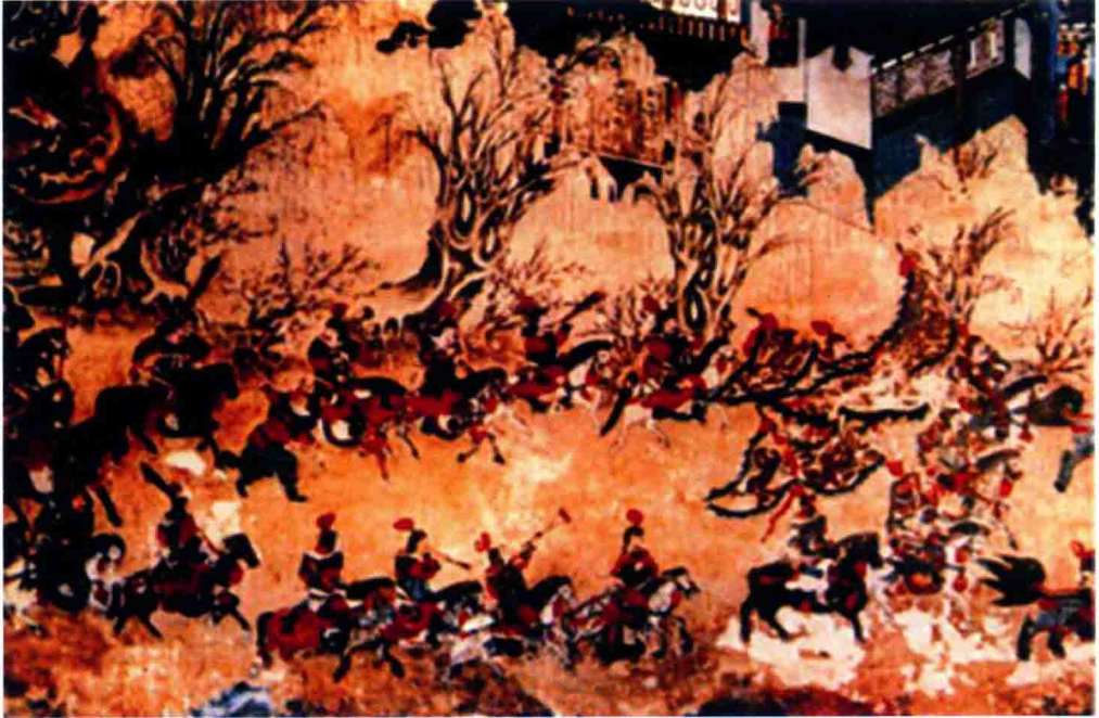
宋·天贶殿鼓吹乐壁画