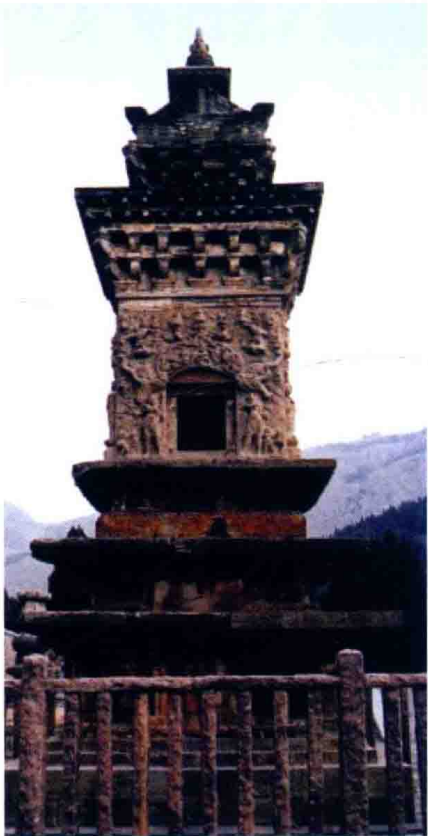
唐·龙虎塔伎乐石刻