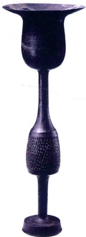
先秦·蛋壳黑陶高柄杯