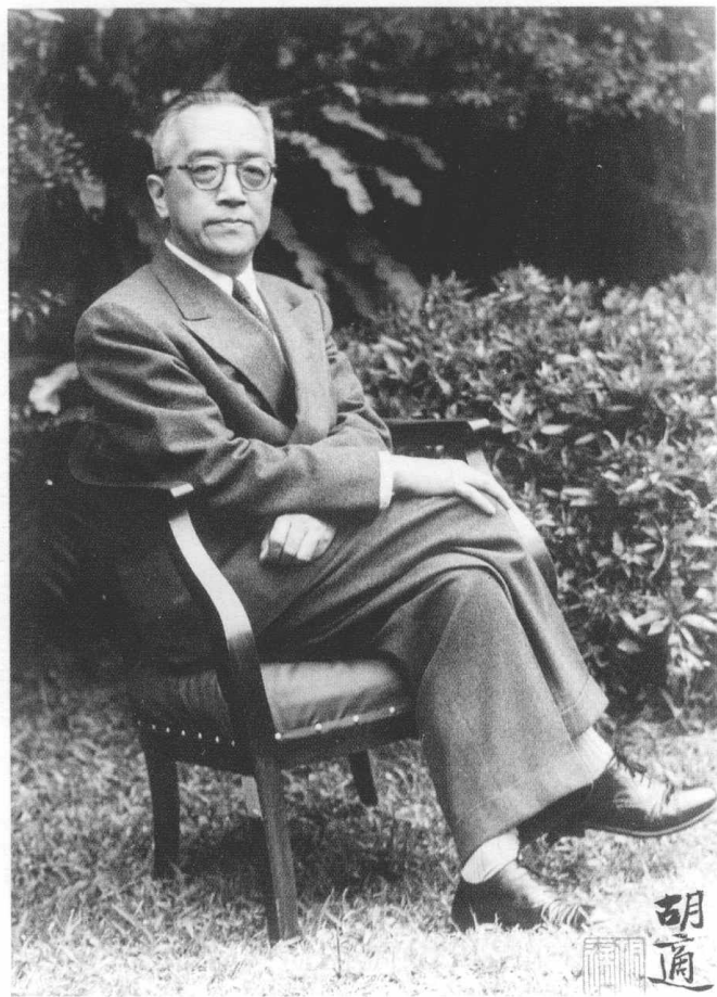
胡适 (1891—1962)