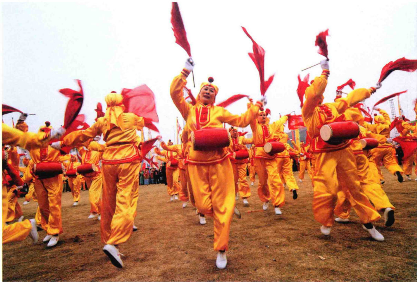
农村秧歌队在第七届义乌农村文化节上表演