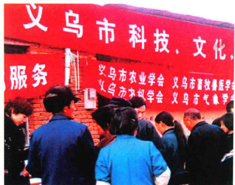
2007年市科技局、科协组织的科技、文化、卫生三下乡活动现场