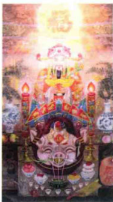
义乌农民创作的农民画