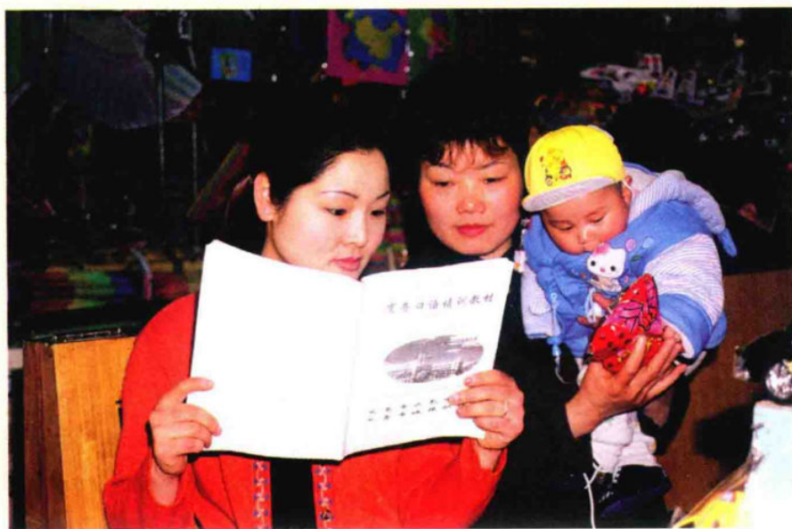
市场经营户学习商贸英语