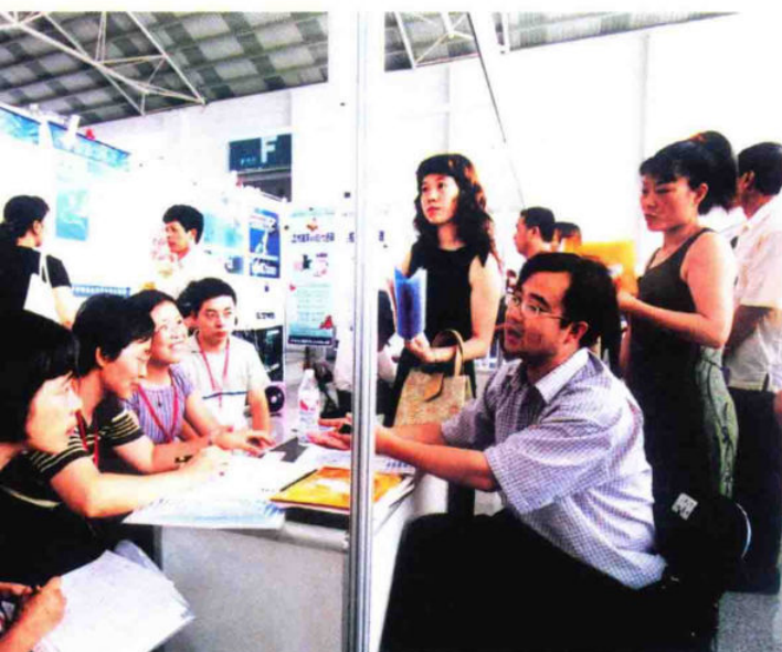
2003年义乌市举行第三次百名专家千名企业家科技对接活动