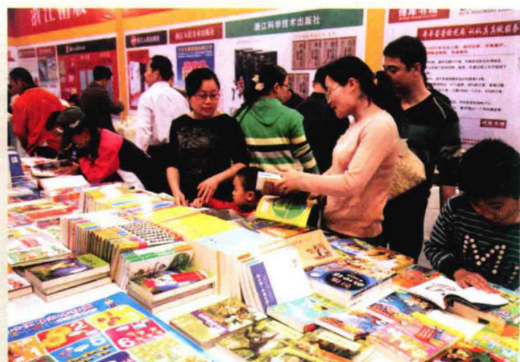
义乌市民好学成风，图为市民争相选购科技图书。