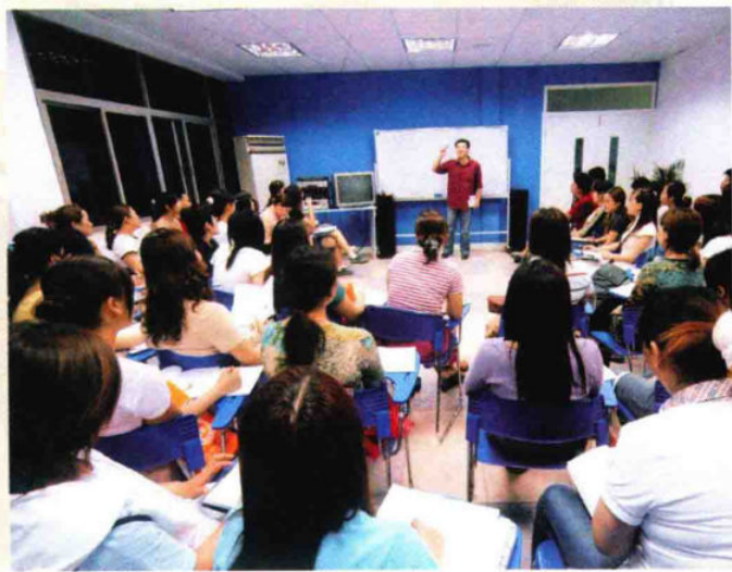
市场经营户在学外语