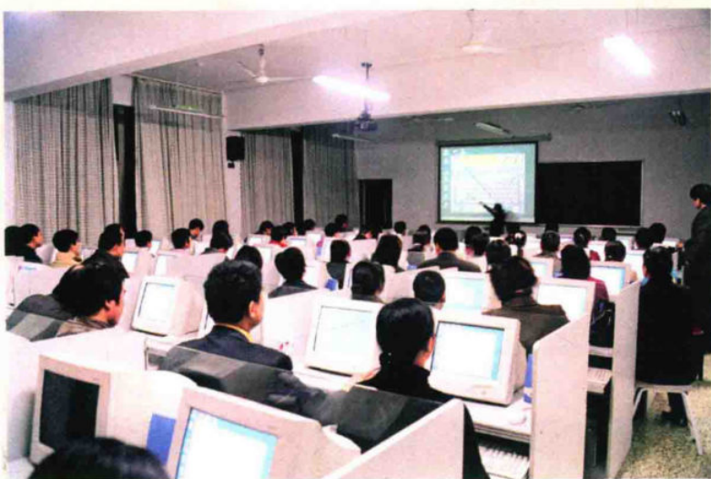
市场经营户在学电脑