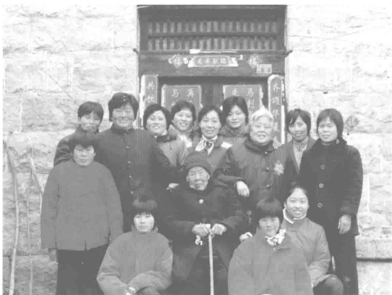
图 3-1 金乡县羊山镇高胡同村某家的女性合影

山东的家族还有起堂号的习俗，至二十世纪三四十年代仍流行。望族堂号大多有其来历，孟子家族的堂号“三迁堂”，是由“孟母三迁择邻”之典而来；曹氏一支堂号“平阳堂”，是由汉代丞相曹参封平阳侯而得名。一般家族堂号的命名多取吉利