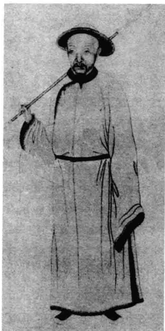
辑自《中国历代名人图鉴》 上海书画出版社 1989年

洪亮吉（1746—1809），字稚存、君直，号北江，又号更生居士。常州府阳湖县（今江苏武进）人。6岁丧父，贫困就外家读，聪颖倍常儿。乾隆五十五年（1790）进士，授翰林院编修。嘉庆元年（1796），因直言忤上，远戍伊犁，嘉庆五年（1800）特旨赦回，因号更生居士，放浪山水间。洪氏博览群书，游历甚广。长于经史、训诂、地理之学，工诗及骈文。诗与黄景仁并称“洪黄”，经学与孙星衍齐名，人称“孙洪”。著述甚多，有《六书转注录》、《补三国疆域志》、《东晋疆域志》、《十六国疆域志》、《晓读书斋杂录》、《伊犁日记》等，后总汇为《洪北江全集》。联语才力纵横，以工雅著称。