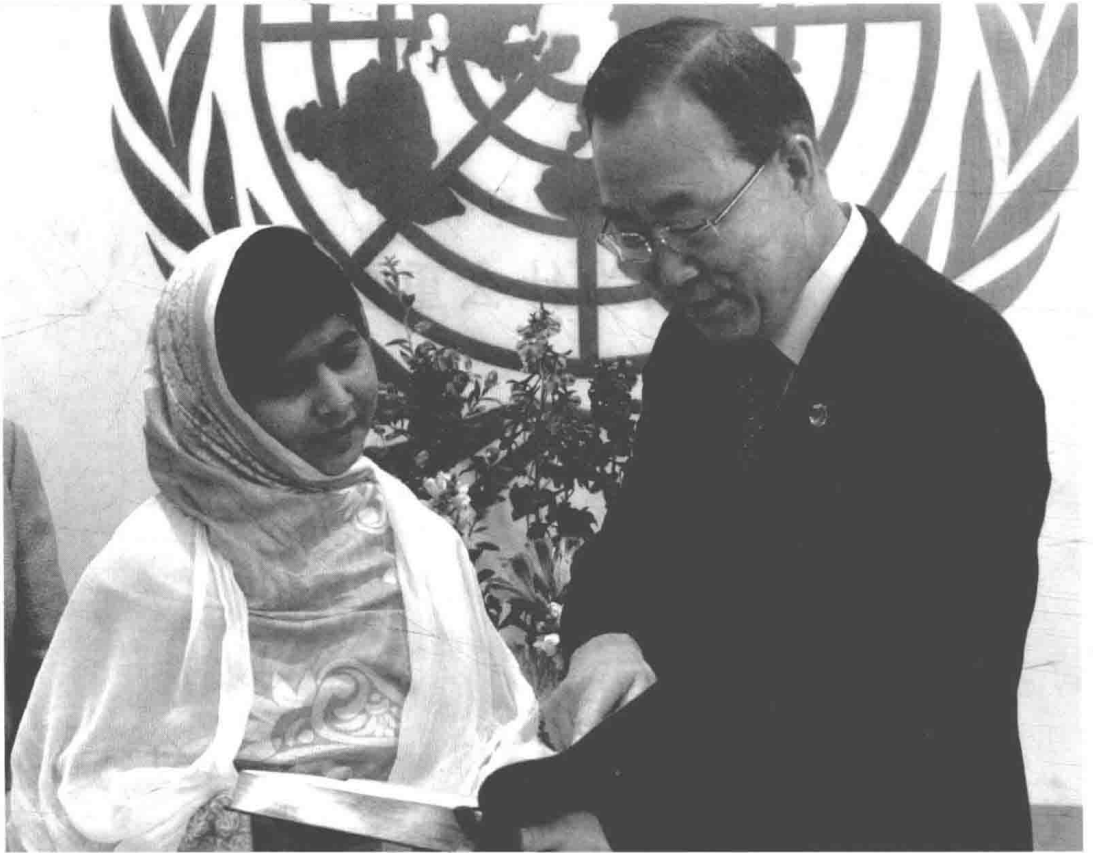
2013年7月12日，联合国秘书长潘基文向巴基斯坦学生马拉拉·尤素福扎伊（Malala Yousafzai）赠送《联合国宪章》。尤素福扎伊曾在上学的路上遭塔利班枪击。她因倡导女童的受教育权成为塔利班攻击的对象