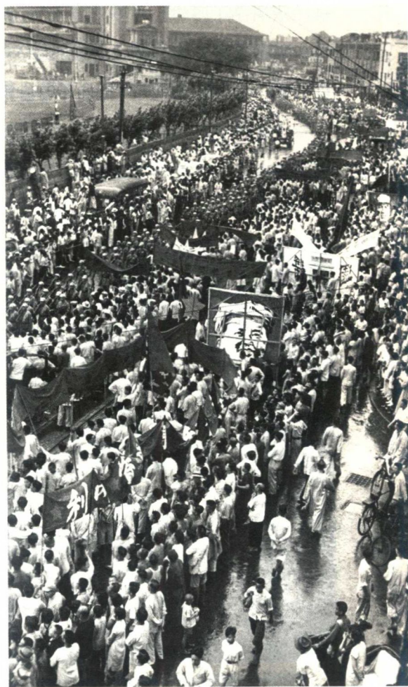
上海市民雨中举行游行庆祝新中国成立