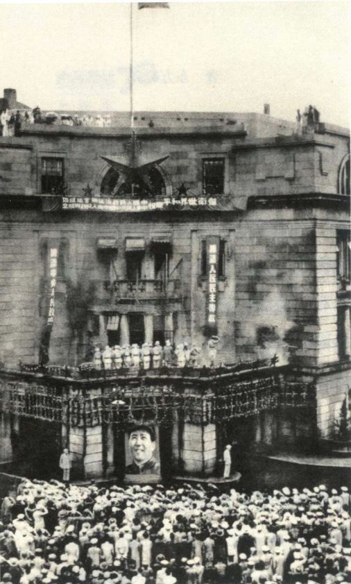
1949年10月2日，中华人民共和国成立第二天，上海市人民政府大厦上升起五星红旗