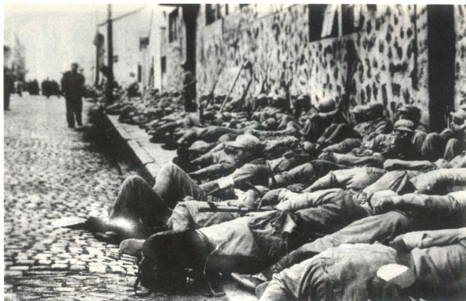
人民解放军进入上海市区后，为了不惊扰市民，不入民宅，和衣而卧露宿街头

1949年5月12日，解放上海的战役打响。5月27日，经过15个昼夜的激战，在付出了伤亡3万余人的代价后，上海解放。经毛泽东亲自审阅修