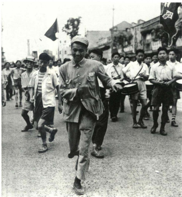
1949年6月12日， 解放军官兵与市民扭秧 歌欢庆上海解放