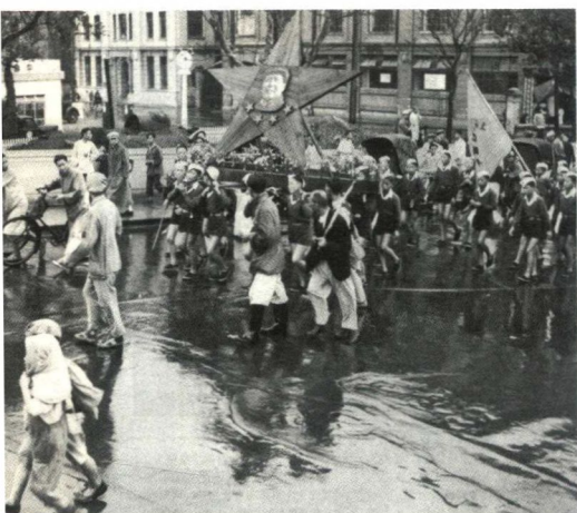
1949年10月，上海市民冒雨举行游行庆祝新中国成立