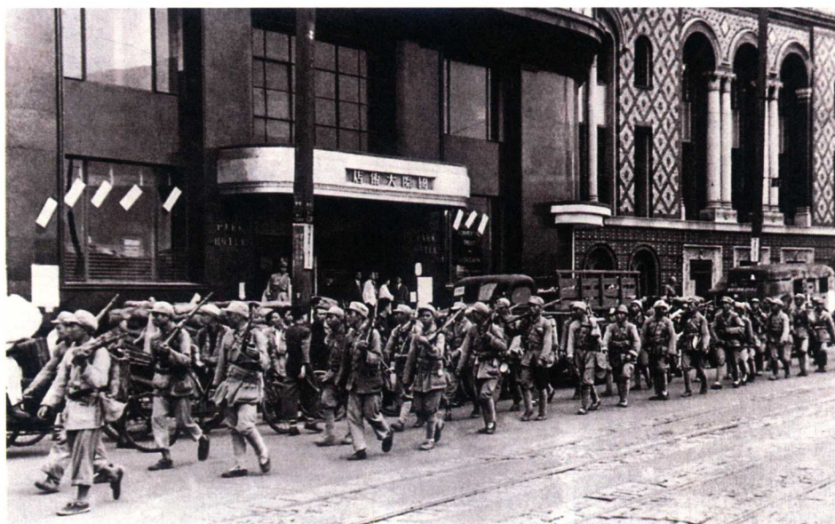
1949年5月，解放军经过南京路国际大饭店

1949年4月，人民解放军百万雄师过大江，突破国民党苦心经营的长江防线，以迅雷不及掩耳之势占领了国民党统治的心脏——南京。在苏南地区陆续解放后，解放全国最大的城市——上海就成为了重要目标。毛泽东曾