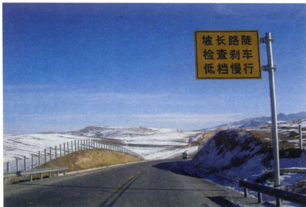
连霍高速进入河西走廊段(2006年12月摄于西夏考察之旅)