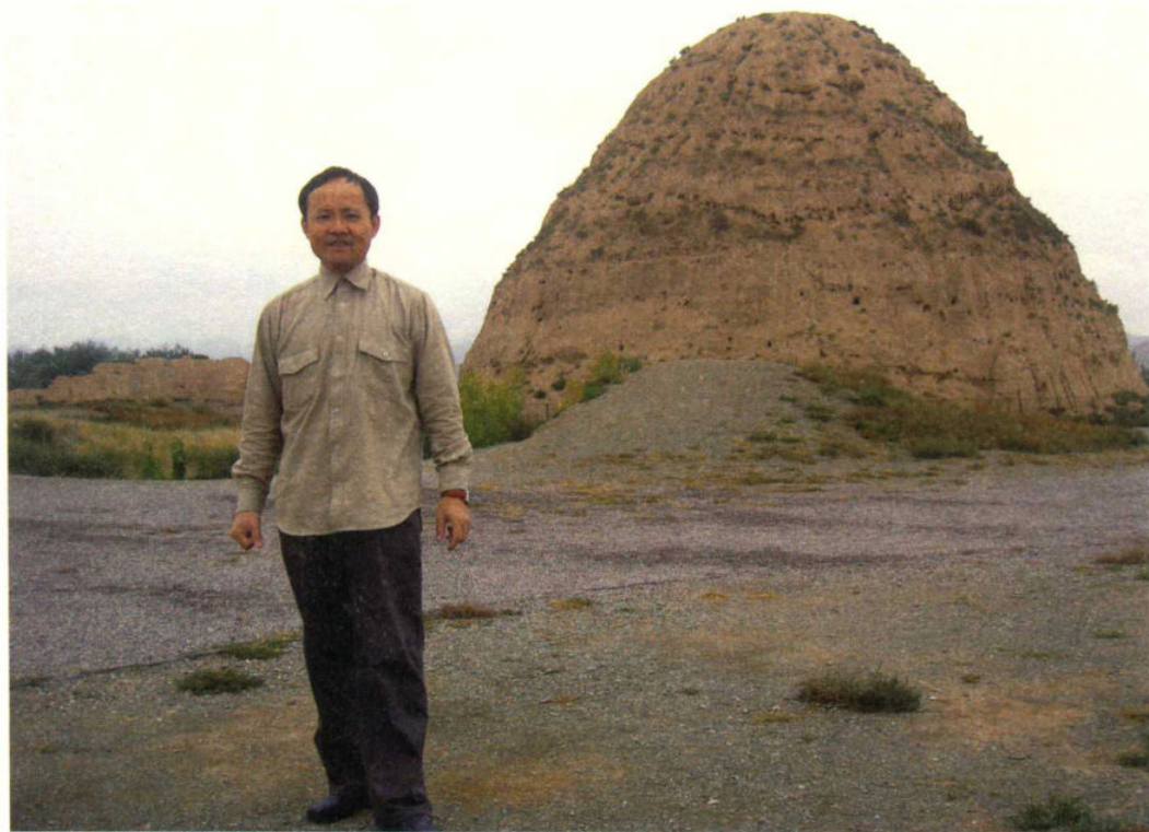
作者2007年9月再访西夏王陵