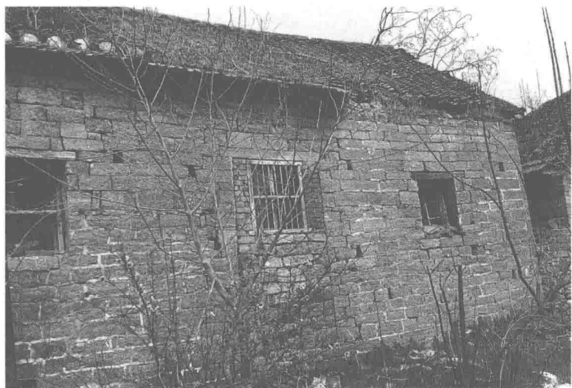
21世纪初，朝阳集的老房子。