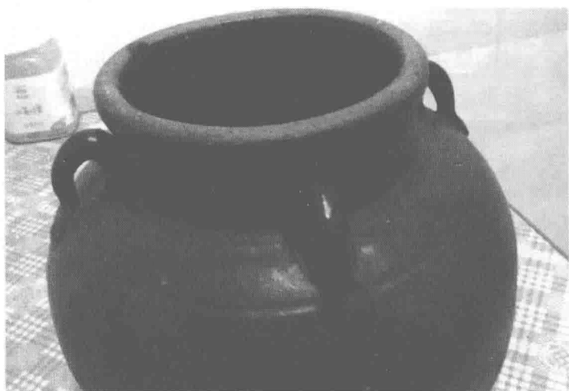
淮北的老腌菜坛子