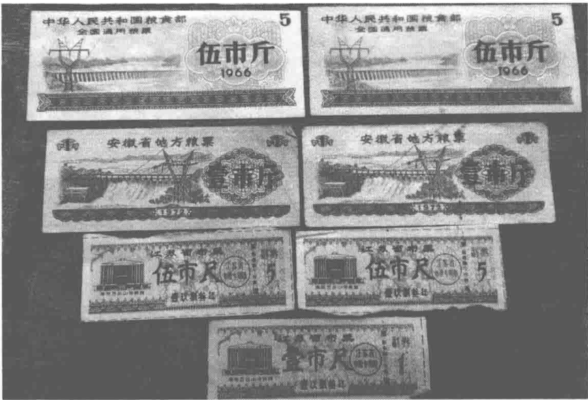
外婆和姐妹们用过的票据