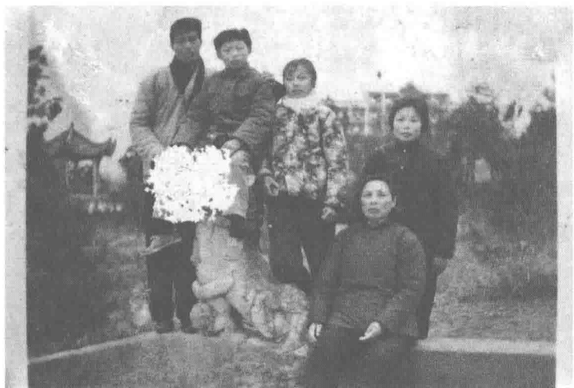
20世纪70年代，黄山，外婆和大女儿一家。