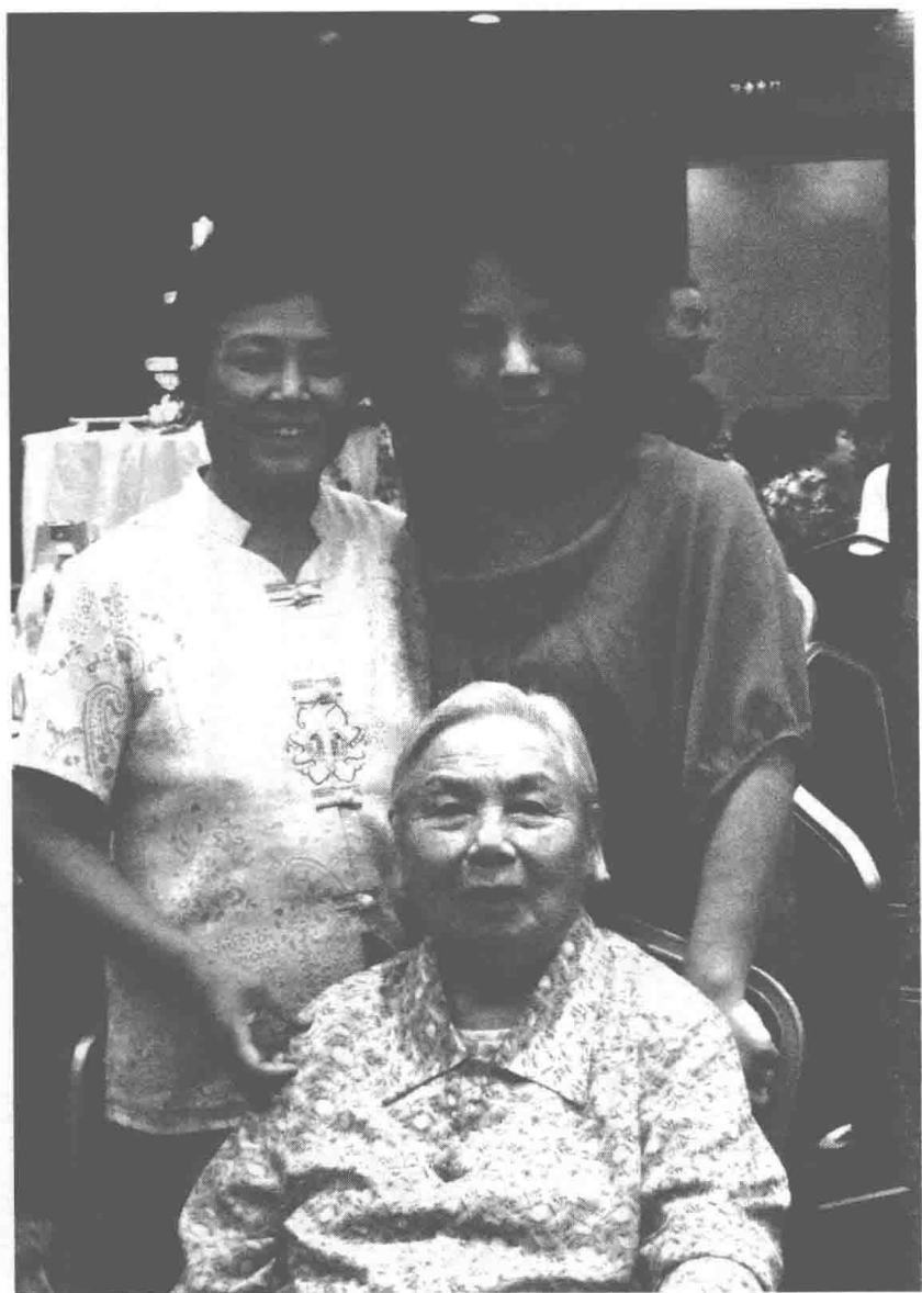
2009年，合肥，外婆和作者母女。