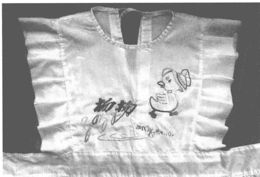
20世纪80年代，外婆给作者绣的围兜。