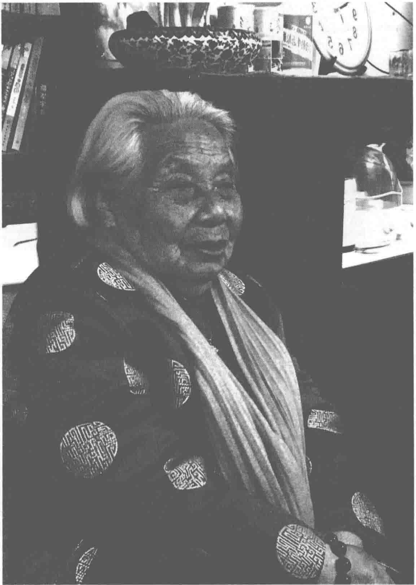
外婆百岁寿辰留念