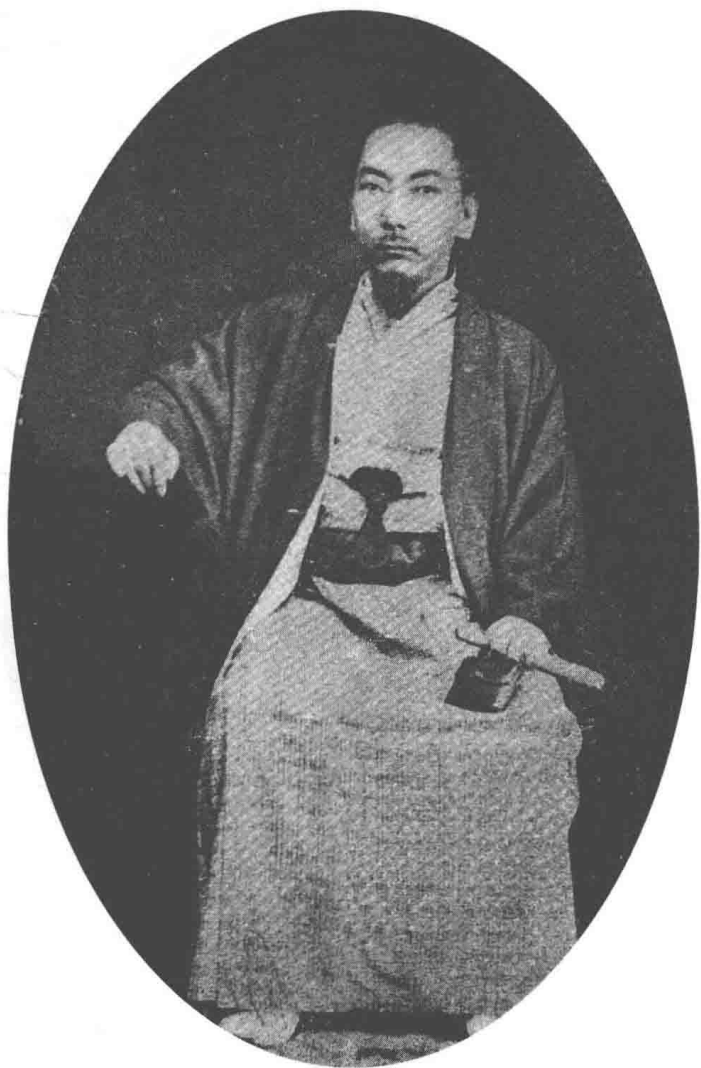
琉球国末代国王尚泰