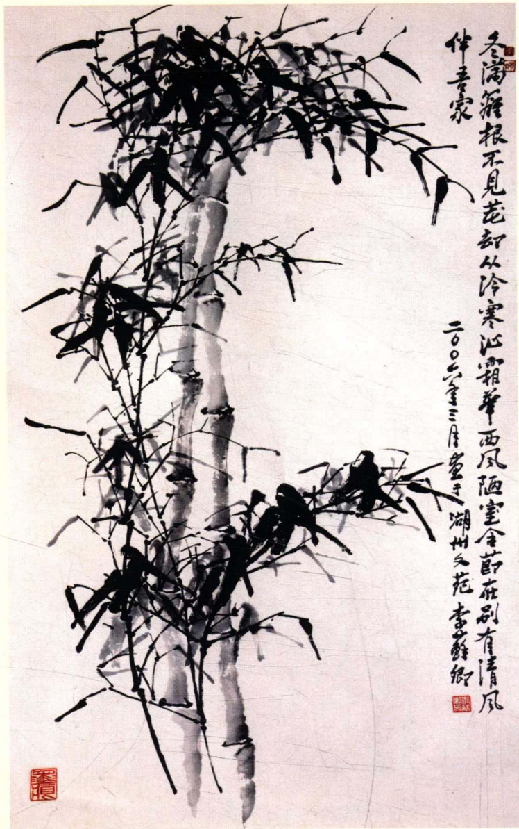
墨竹 (国画) 作者: 李苏卿