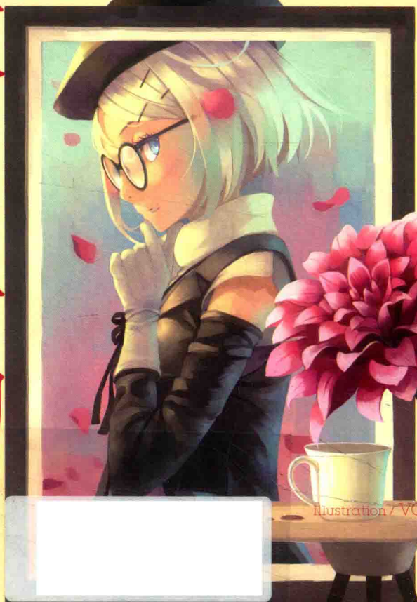
Illustration / VOFAN 绘