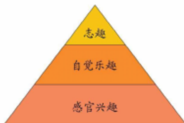
图 1-2 兴趣金字塔模型

兴趣的产生和发展遵循一个金字塔模型 (见图 1-2), 即从最初的感官兴趣, 到自觉乐趣, 再到志趣层次。