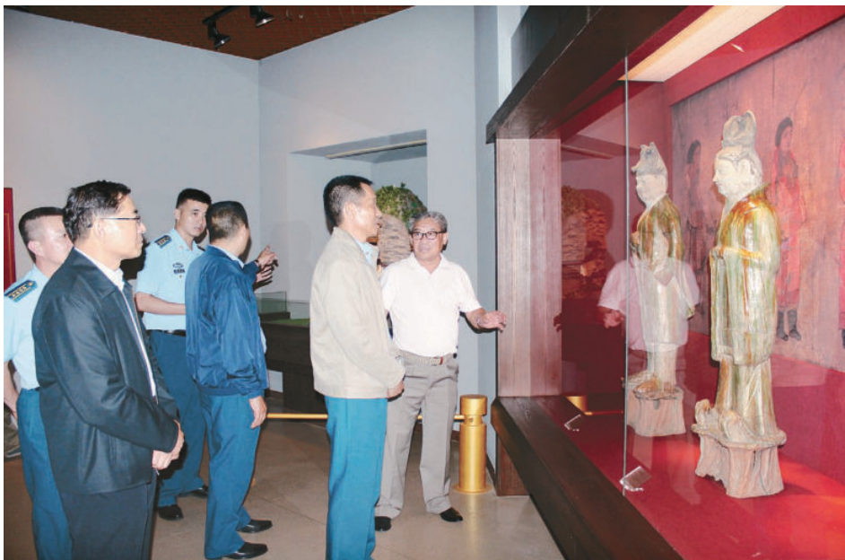
6月24日，西部战区副政委兼西部战区空军政委舒清友同志一行在省文化厅副厅长、省博物馆馆长俄军，馆党委书记王裕昌，副馆长史册的陪同下参观《甘肃丝绸之路文明》展览