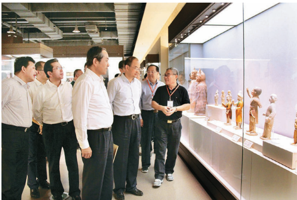
8月27日，文化部部长雒树刚、省委书记王三运、省长林铎、国家文物局副局长刘曙光、副省长夏红民、省委宣传部部长梁言顺等领导一行考察“敦煌文博会”中国馆。省文化厅副厅长、省博物馆馆长俄军陪同并做详细的讲解和介绍