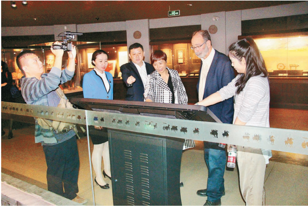
9月22日，诺贝尔经济奖得主埃尔文·罗斯、我国著名经济学家许小年和读者出版传媒股份有限公司副总经理王卫平一行参观甘肃省博物馆