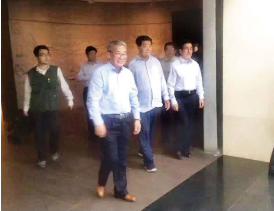
5月31日，全国政协原主席贾庆林一行莅临甘肃省博物馆参观，省文化厅副厅长、省博物馆馆长俄军陪同