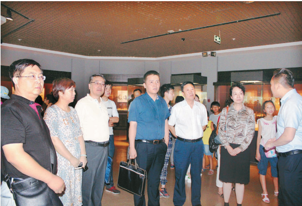
8月11日，中央编办国家事业单位管理局培训班一行来我馆参观调研