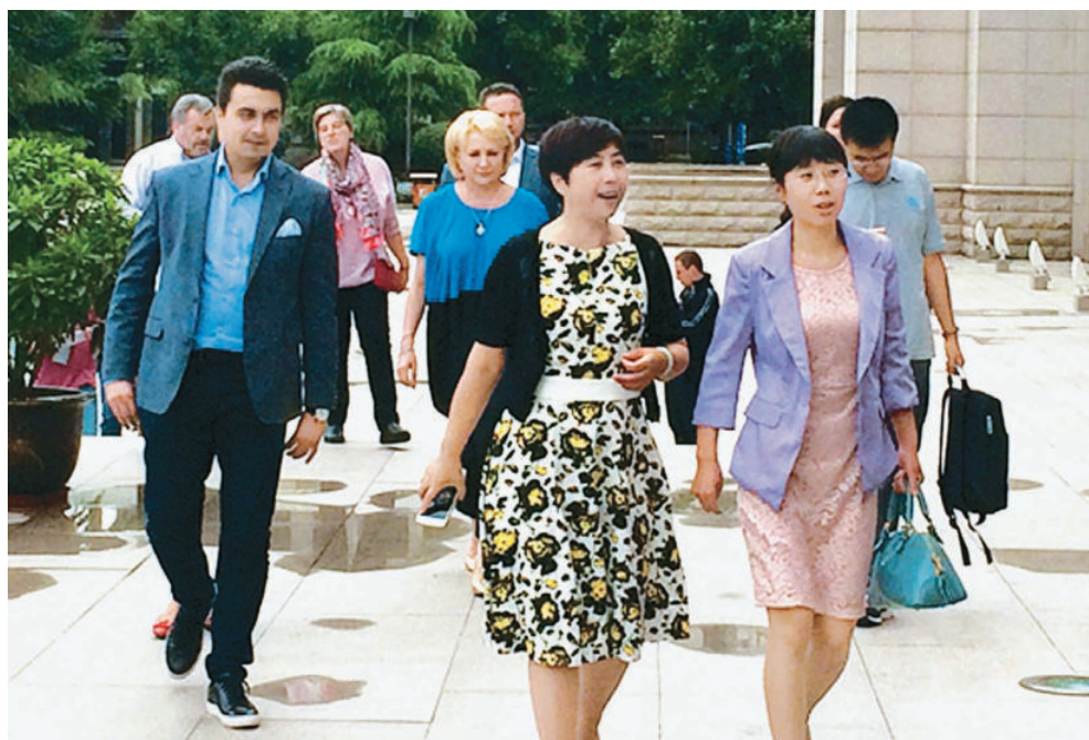
7月18日，以欧洲议会旅游交通委员会主席、匈牙利社会党副主席乌伊海伊·伊什特万为团长的欧洲议会跨党团青年政治家考察团一行14人在中联部八局局长张建国、甘肃省政府外事办副主任张宝军及省博物馆副馆长史册的陪同下参观《甘肃丝绸之路文明》展览