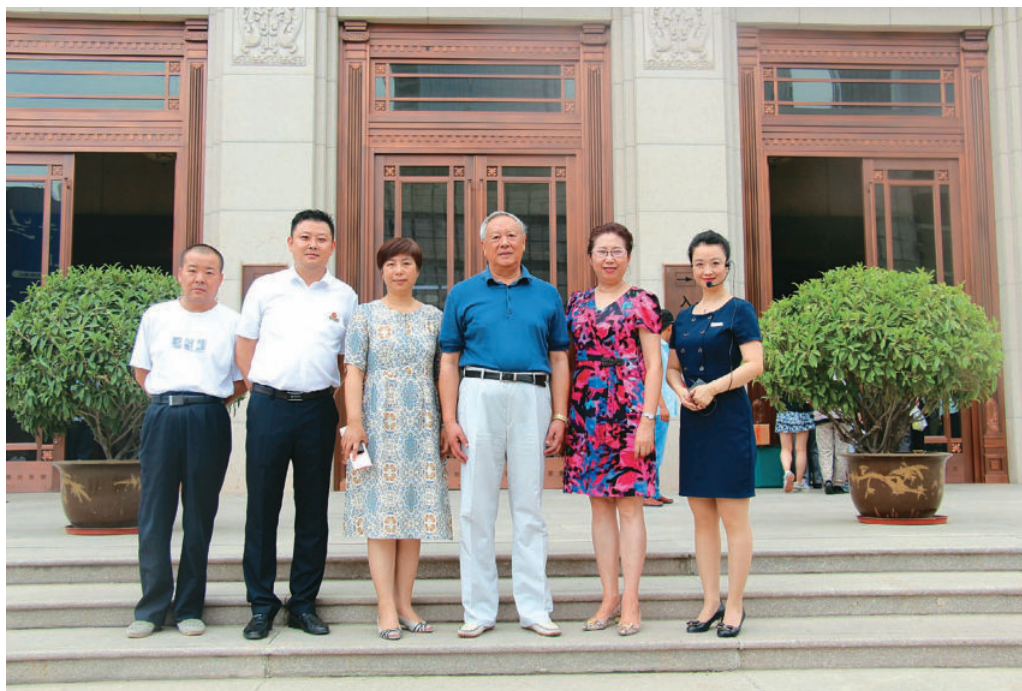
8月14日，原中共中央军事委员会委员、中华人民共和国中央军事委员会委员、中国人民解放军总参谋长陈炳德上将一行莅临甘肃省博物馆参观