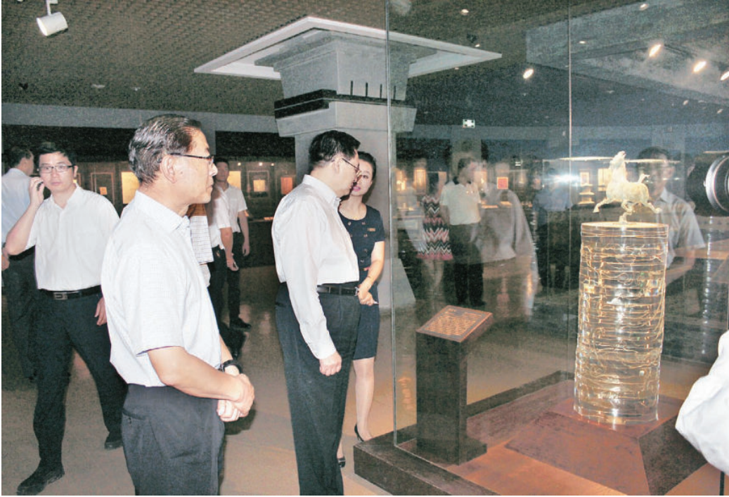
7月21日，青海省委委员、常委、书记王国生一行在甘肃省委常委、省委秘书长李建华，甘肃省博物馆党委书记王裕昌，副馆长贾建威、史册的陪同下参观我馆