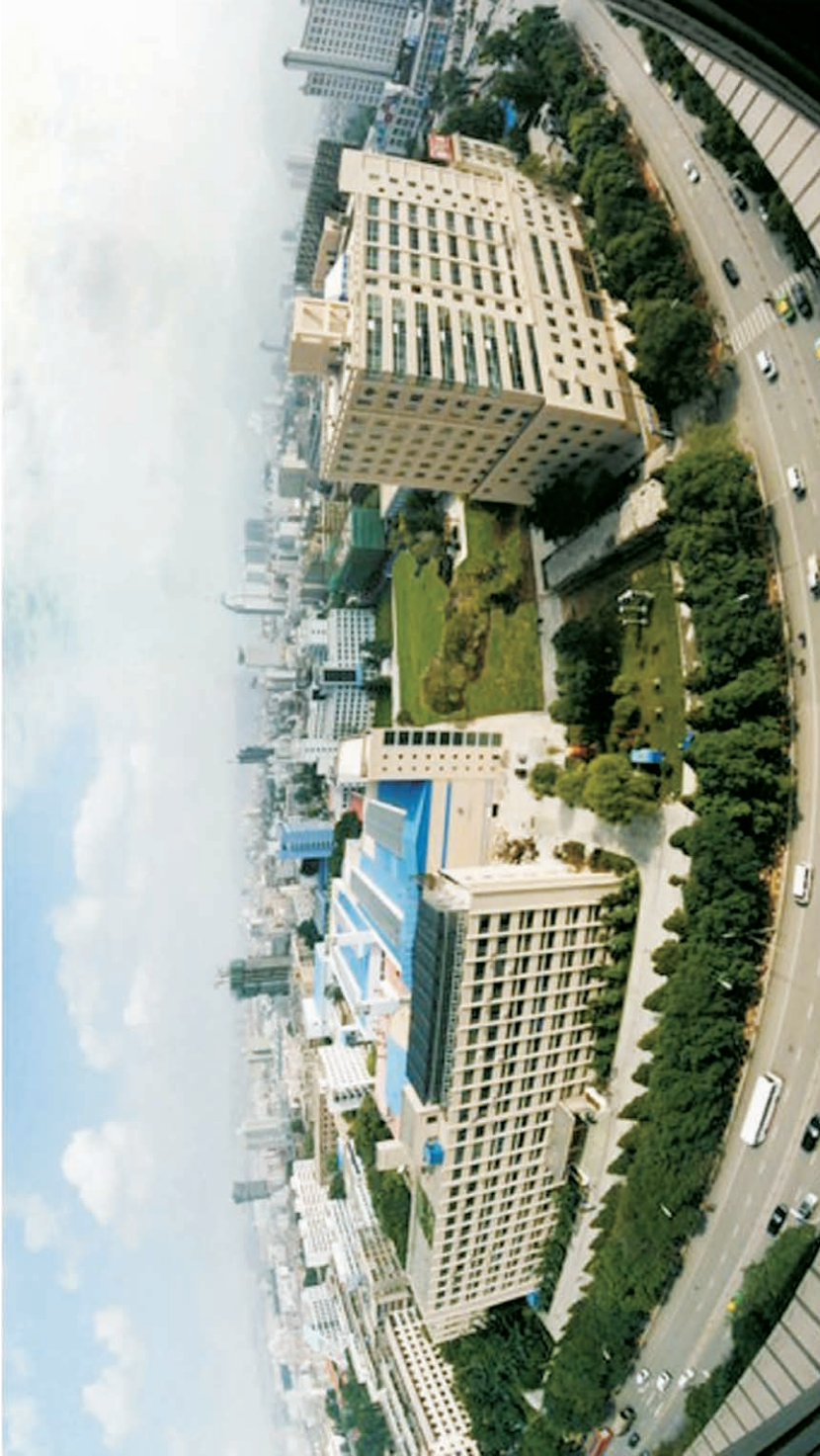
今日之中国科学院近代物理研究所(兰州)