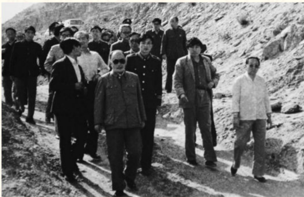
◆1988年5月18日，全国政协副主席马文瑞（前）视察神府煤田