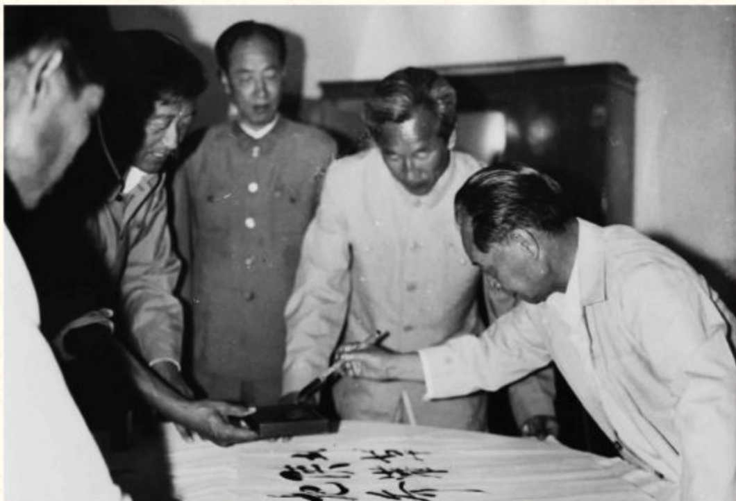
◆1985年6月，中共中央总书记胡耀邦（右一）在神木、府谷视察工作并题词