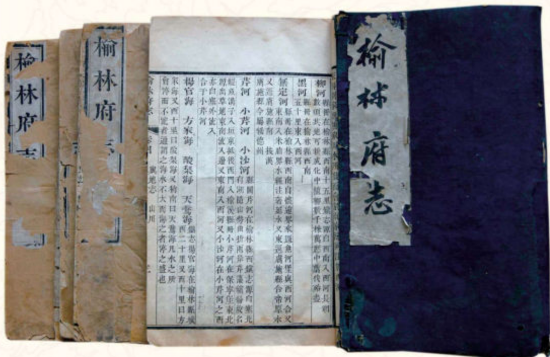
◆清道光二十一年（1841）李熙龄纂修的《榆林府志》（榆林市档案馆藏）