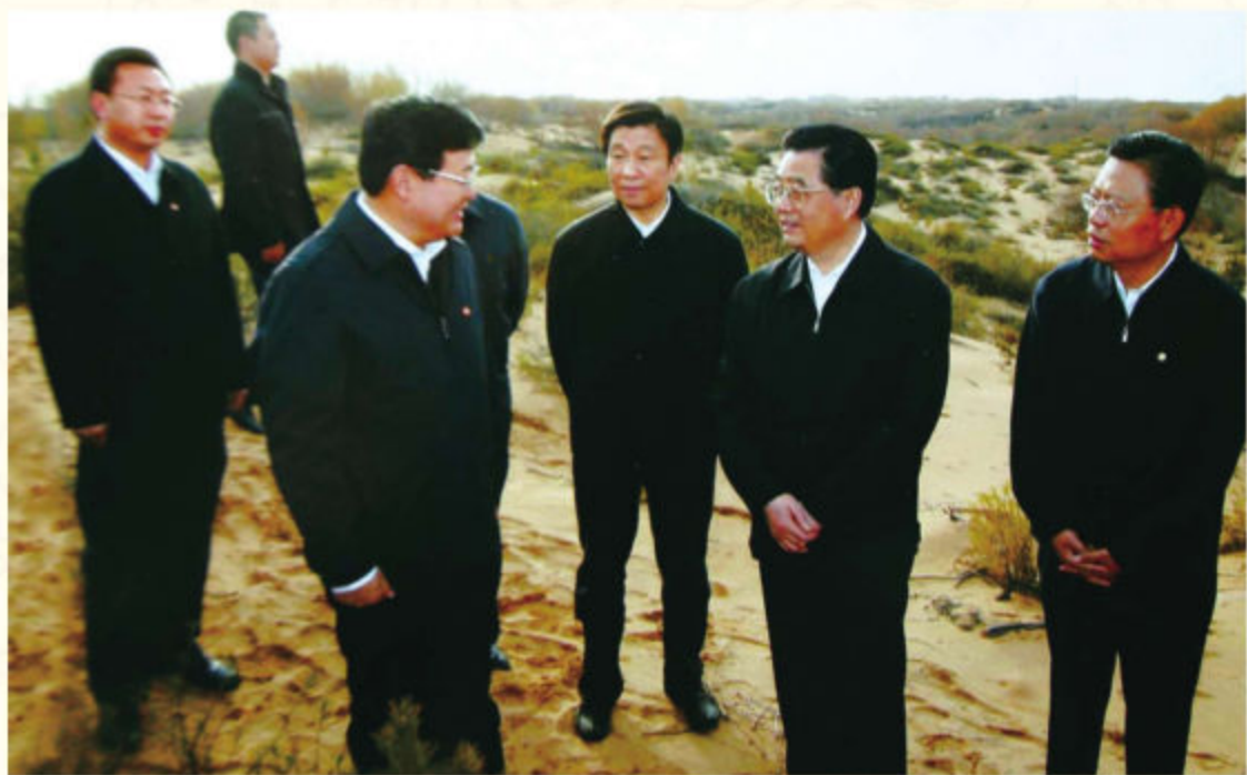
◆ 2008年10月29日，中共中央总书记胡锦涛（右二）在榆阳区小纪汗乡昌汉界治沙点考察治沙造林和生态建设