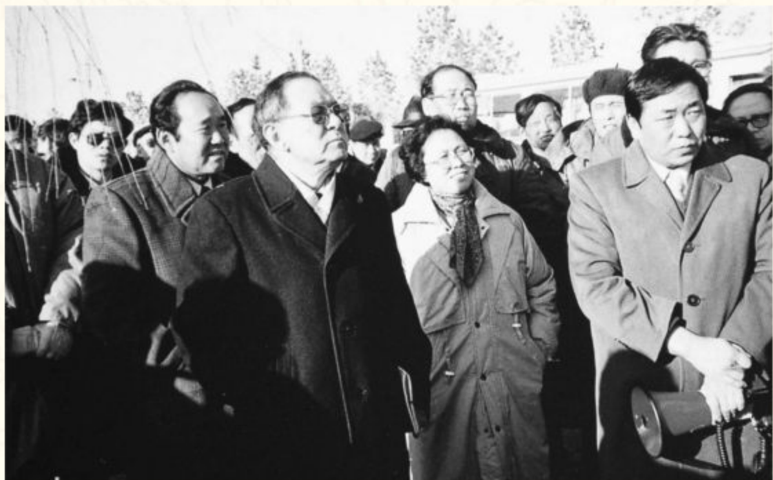
◆1993年11月，国务委员宋健（前排左一）在榆林主持召开晋陕蒙接壤地区能源环境检查现场会，研究解决煤田开发中的环境污染问题，图为在神府矿区视察