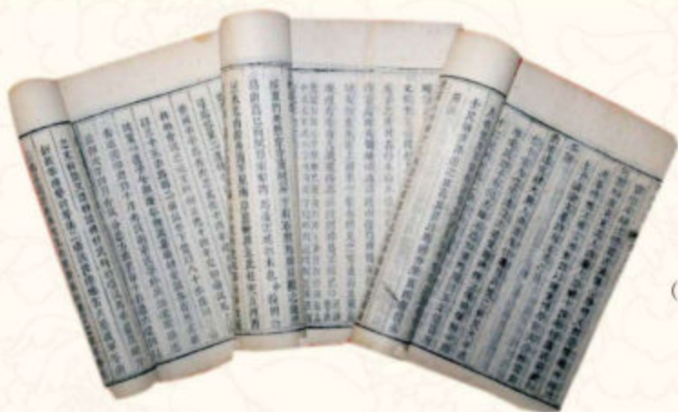
◆八卷本乾隆年间《府谷县志》 （府谷县档案馆藏）