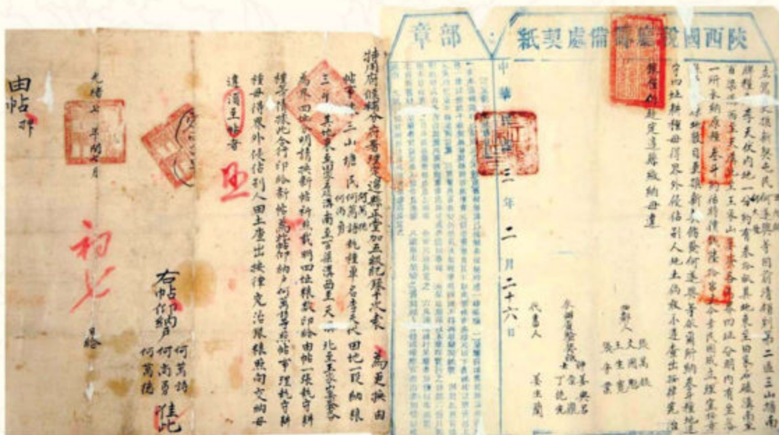
◆ 光緒七年（1881）閏七月出具的土地證及中華民國三年（1914）二月二十六日陝西省國稅院籌備處更換的契證（定邊縣檔案館藏）