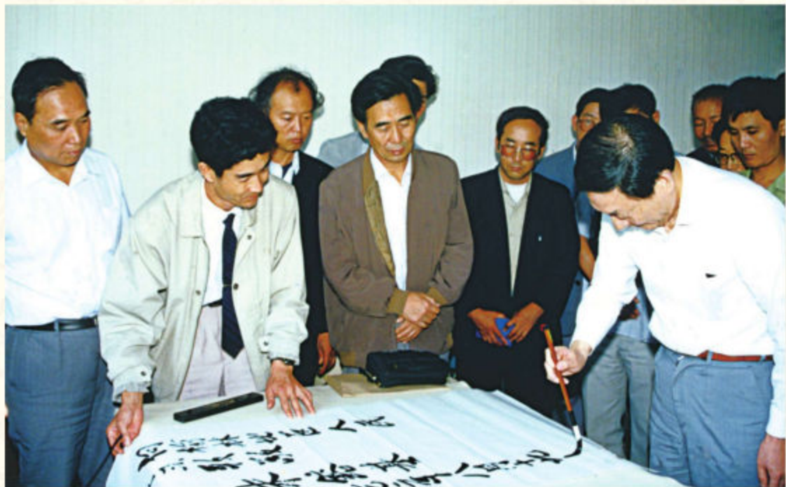
◆1992年8月，国务院副总理朱镕基（右一）在榆林宾馆大会议室为全区做报告并为榆林题词