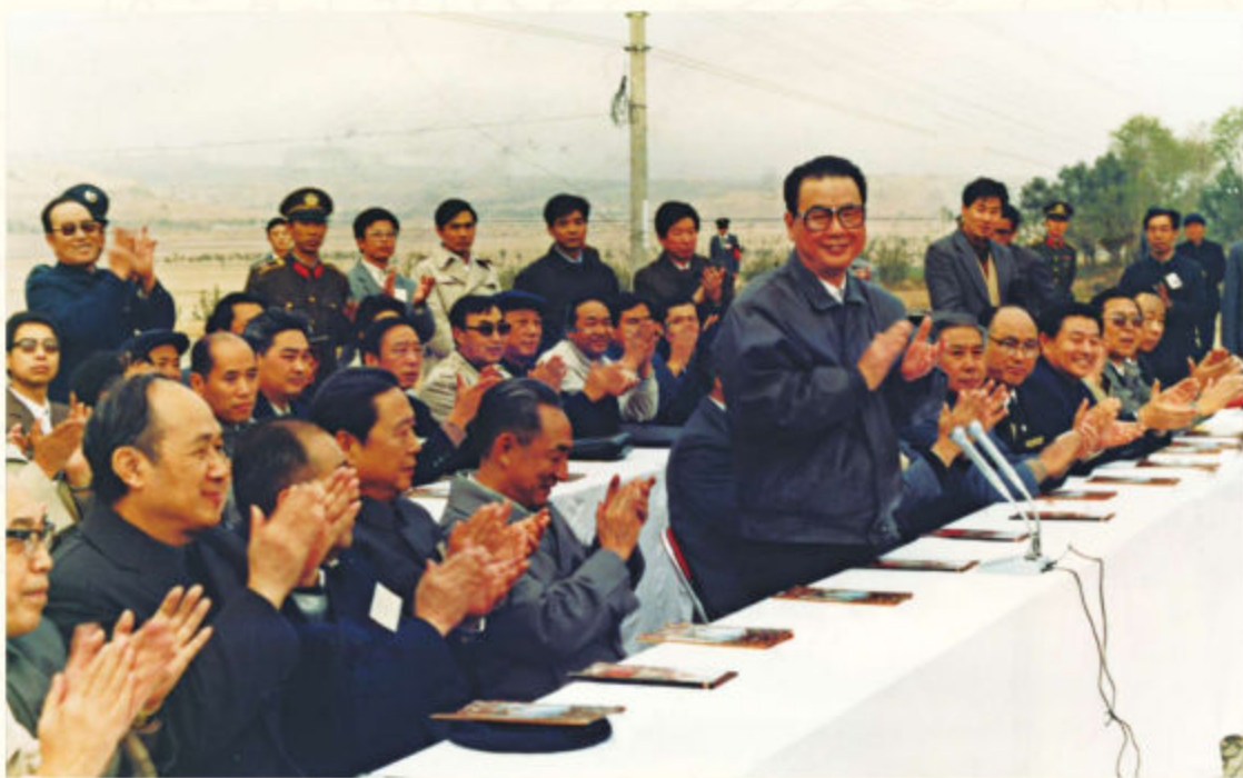
◆1989年10月，国务院总理李鹏（中）在神包铁路通车典礼上讲话