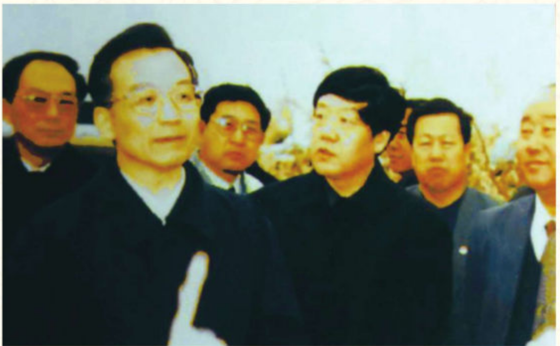
◆2000年4月，国务院副总理温家宝（左）在榆林调查研究