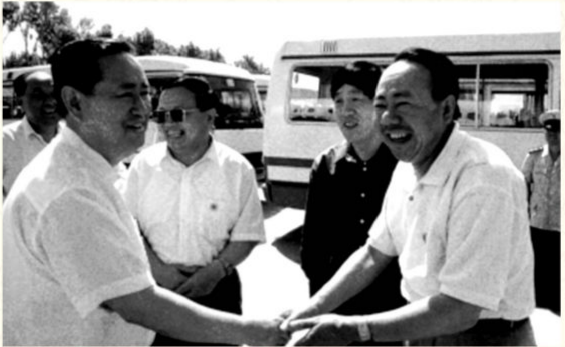
◆1996年6月，国务院副总理姜春云（左一）视察延安、榆林，形成《关于陕北地区治理水土流失建设生态农业的调查报告》。8月5日，江泽民在报告上做重要批示：“再造一个山川秀美的西北地区”