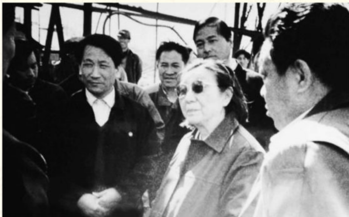
◆1991年4月12日，全国政协副主席、水利部部长钱正英（中）视察神东矿区