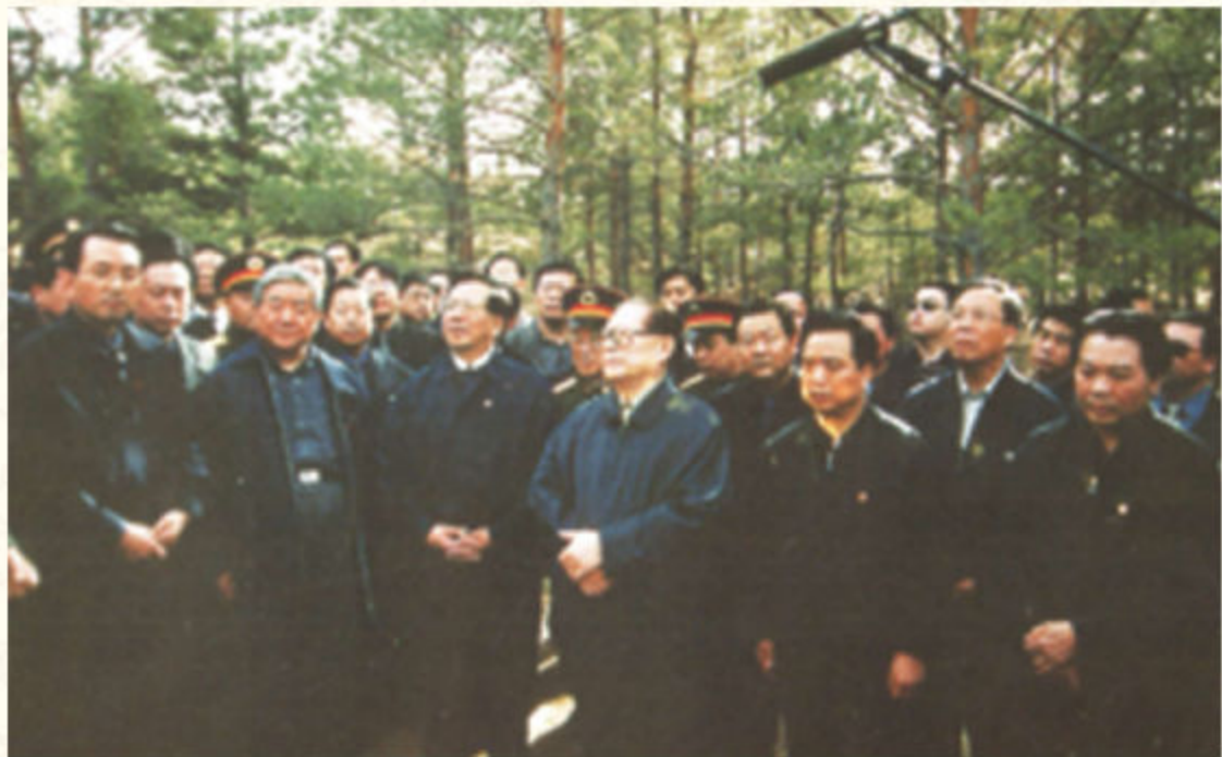
◆ 2002年3月，中共中央总书记江泽民及曾庆红、曾培炎等领导在榆林视察能源化工基地建设