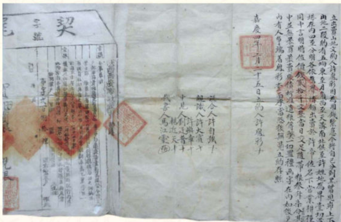
◆清嘉庆四年（1799）许凤彩卖地于许帝佐的土地买卖契约（榆林市档案馆藏）