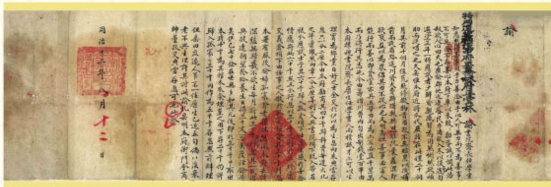
◆ 此諭是榆林時任知府林士班于同治十二年（1873）八月十二日給任學重的指示：關於設立資教濟困基金有關問題的安排（榆林市檔案館藏）