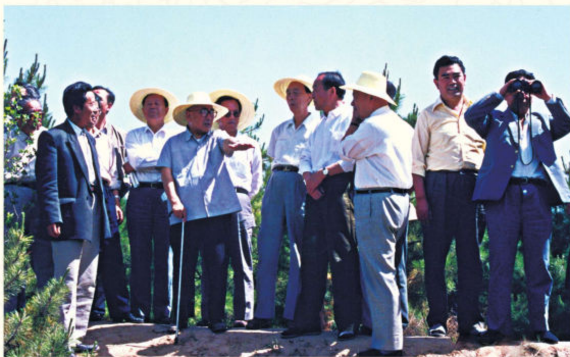
◆1992年6月，全国政协副主席卢嘉锡（左五）在榆林红山参观治沙造林