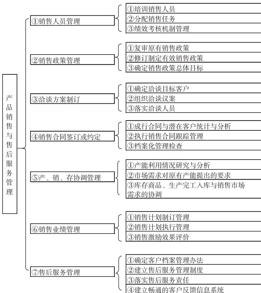
图1-3 销售部门工作流程图

企业的销售部是以产品销售为主要工作的部门，其流程如下图。负责总体的营销活动，决定公司的营销策略和措施，并对营销工作进行评估和监控，包括公共关系、销售、客户服务等。如公司有新的产品，销售部就要把新产品推销、宣传到一些消费者手里。销售部门销售企业产品必须根据市场的变化和与市场与本企业的关系来推销到合适的有需求的消费者手里。同时，还需要为客户提供相应的售后服务，以提高客户粘性。