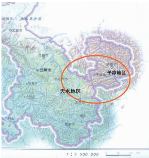
图 1 平凉—天水地区