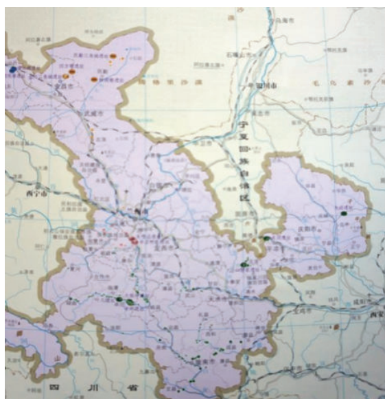
图5 西凉地区和天水兰州地区青铜文化