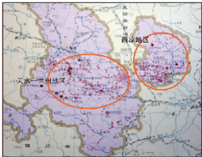
图4 平凉地区和天水兰州地区齐家文化