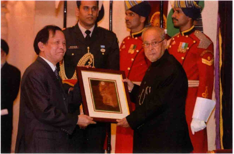
(时任印度总统普拉纳布·慕克吉先生为郁龙余颁授“杰出印度学家奖”， 2016年12月1日，印度新德里总统府)