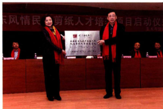
沈阳师范大学美术与设计学院获批的国家艺术基金以及文化部非遗传承人研修研习培训（国培）项目启动