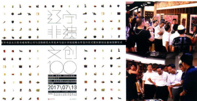
“辽宁非遗文创100”展览活动现场

“北方新生活”作为“全省发行市场一张网”的核心项目，在全省14个城市建设地标式城市文化体验综合体，将北方图书城这一传统实体书店转型升级为“以阅读引领文化体验和消费，塑造读者创造力的文化养成之所；融文化提升、文化体验、文化创意、文化消费为一体的文化生活平台；培养先进文化核心价值和正能量的文化传播基地”。