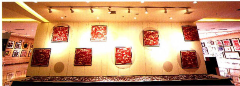
剪纸培训主题创作作品《新盛京八景》《一宫两陵》《醉辽河》亮相沈阳市首届剪纸节