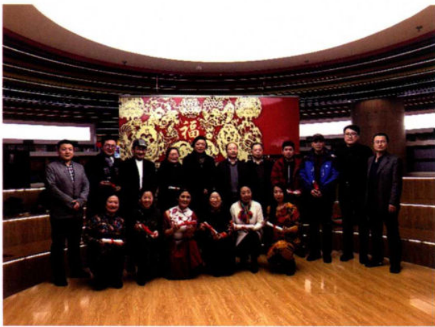
“2018剪纸迎新春 非遗+文创主题展”来宾与传承人合影