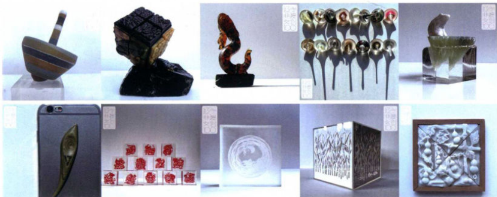
衍生创新（陶瓷与剪纸、扎染与剪纸、服装与剪纸、装置与剪纸、产品与剪纸、皮具与剪纸、煤精雕刻、玛瑙雕刻、玉石雕刻、琥珀雕刻、辽砚雕刻、木雕、根雕、综合材料雕刻）