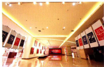
沈阳市首届剪纸节现场