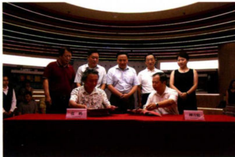
授予沈阳师范大学美术与设计学院“北方新生活非遗文创研发基地”