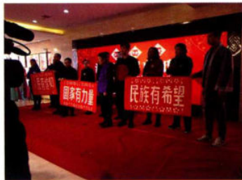
沈阳市首届剪纸节现场