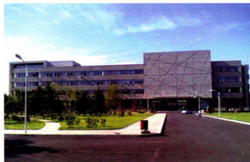
沈阳师范大学美术与设计学院教学楼