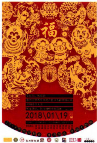
“2018剪纸迎新春 非遗+文创主题展”宣传海报