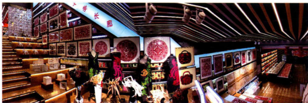
“2018剪纸迎新春 非遗+文创主题展”北方图书城现场

省14个市北方新生活的多元产品线，将非遗文创打造成为北方新生活的特色经营项目，将非遗文创产品塑造成为北方新生活的特色文化产品，在文创衍生品的研发售卖上，注重地域文化和传统文化的结合，同时融入创新性的元素，从而为辽宁非物质文化遗产传承人与广大群众架设沟通的桥梁。