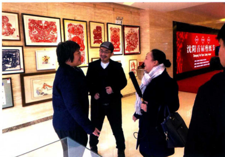
记者采访皇姑区文广局负责人