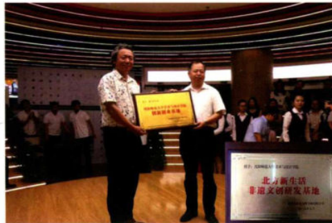
授予北方新生活“沈阳师范大学美术与设计学院创新创业基地”

活动现场，北方图书城与沈阳师范大学美术与设计学院达成战略合作协议，同时，北方图书城授予沈阳师范大学美术与设计学院“北方新生活非遗文创基地”牌匾，沈阳师范大学授予北方图书城“创新创业基地”牌匾，以此开启了双方从辽宁非遗到国家项目、从国家项目到共建平台、从共建平台到专业发展及商业提升的供应模式，积极为辽宁非遗的发展做出贡献，挖掘非遗之美，一起绘出中国风的大美风韵。