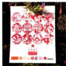
“非遗+文创产品”亮相沈阳市首届剪纸节