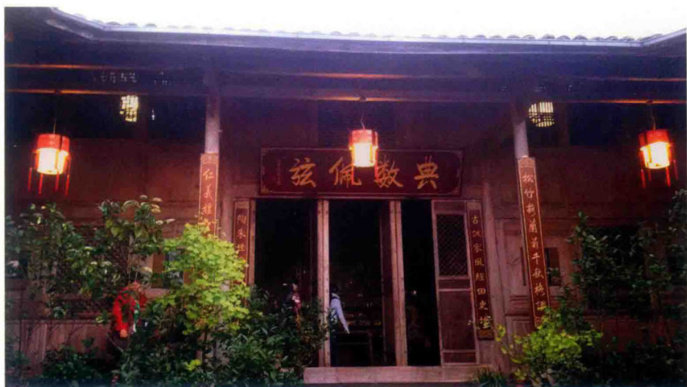
茂恒商号家宅