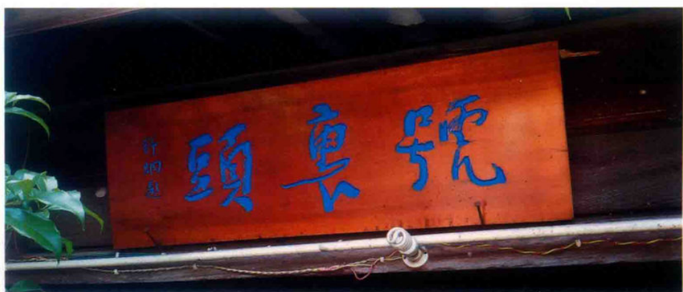
和顺“号里头”商号匾额