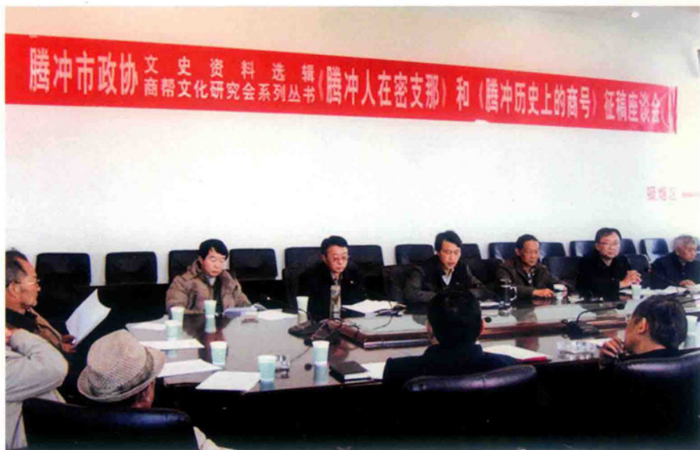
腾冲市政协召开《走出去·密支那篇》和《腾冲历史上的商号》征稿座谈会。