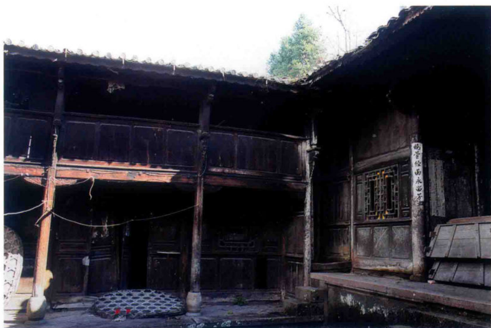
永茂强商号老宅