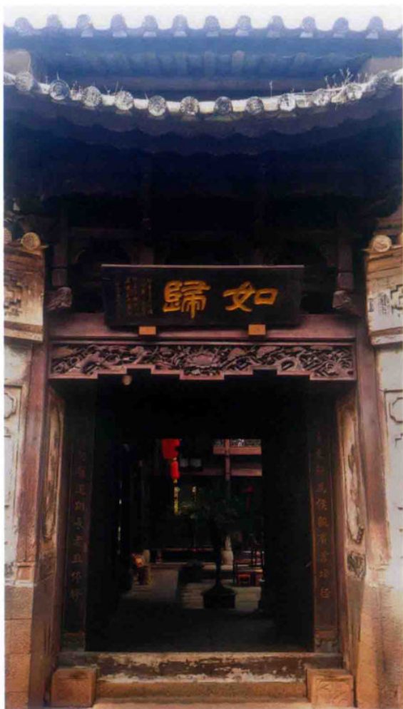
“兴顺号”商号老宅