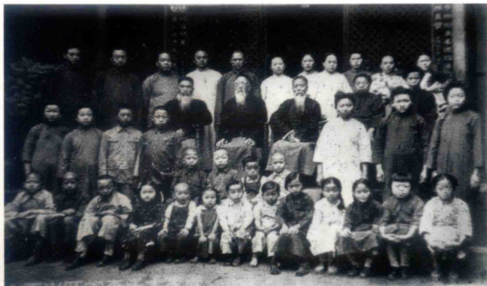
永茂和商号全家照