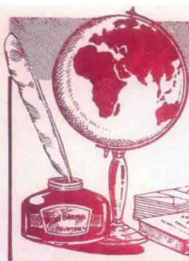
二十世纪五十年代缅甸华侨商号所做的广告 (董平 供稿)

TAIK BEE & BROS. Importers of Cycles Accessories 632, Dalhousie St., RANGOON.