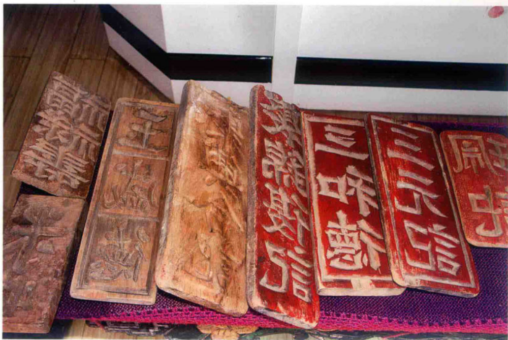
腾冲历史上的商号印章