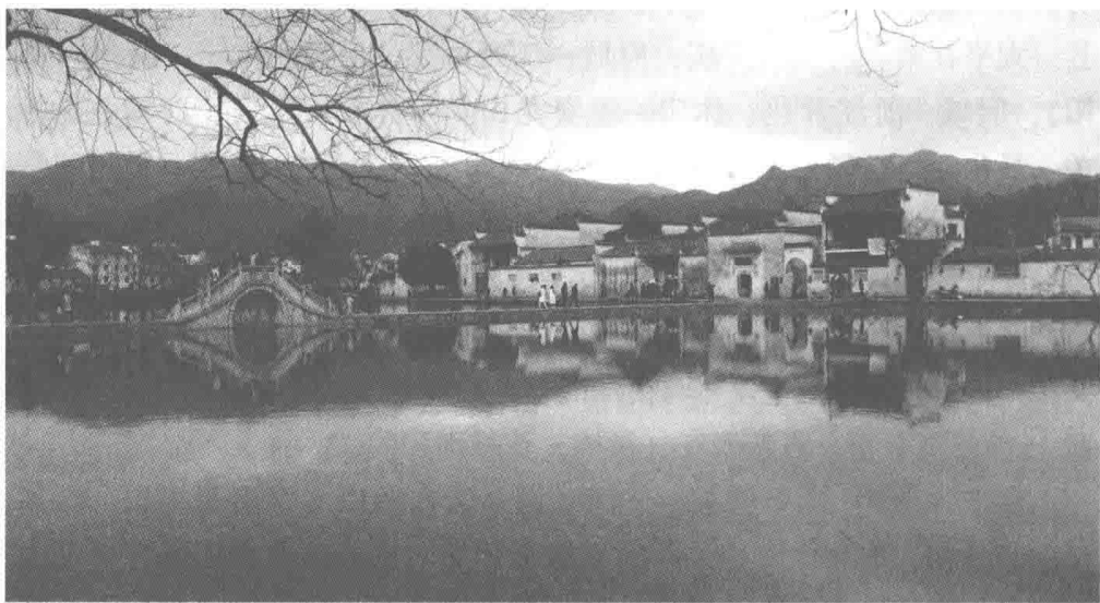
世界遗产宏村（2017年）

黟县，是黄山市下辖县，因黟山（黄山）而得名，居黟县盆地中。县城碧阳镇，距屯溪 54 公里。茧丝绸产业为皖省第一，素称“竹木之乡村”，为全国重点产茶县，有塔川国家森林公园。历史上名人荟萃，有张小泉（明崇祯年间）、俞正燮（1775—1840）、赛金花（1870—1936）、黄士陵（1849—1908）、汪大燮（1859—1929）、舒绣文（1915—1969）等。徽州“八山一水半分田，半分道路倚庄园”，青山绿水，粉墙黛瓦，云雾低荡，桃源景象，跃然眼前。黟县又被称为“中国画里乡村”。有世界文化遗产西递、宏村古村落。西递，距县城 8 公里，保存有完好的明清古民居建筑 124 幢、祠堂 4 幢、牌楼 1 座，有“明清古民居博物馆”“桃花源里人家”之美誉。2000 年，联合国教科文组织专家评曰：“中国古村落的杰出代表，徽文化和典型地方文化特色的具体体现，中国民间建筑艺术的宝库。”宏村，位于黄山南麓，以其田园风光、古村落形态、工艺精湛的徽派民居和丰富多彩的历史文化内涵而闻名，教科文组织专家评曰：“像宏村这样美丽的乡村水街景观可以说是举世无双。”