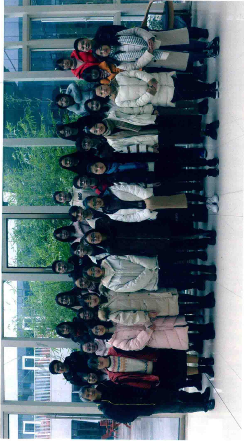
主要采写人员合影