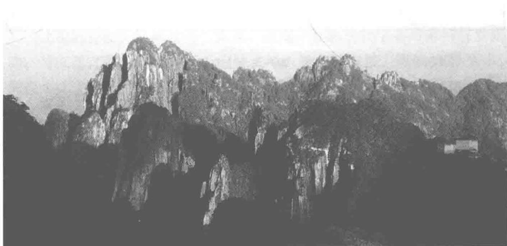
黄山秀色（2005年，丁镠音摄）

田、学田等，以保证公共建筑永续不断。于是，徽州有了“十户之村，不废诵读”的重文风气，“一村之中不染他姓”的村落镜像，“千年之冢，不动一抔；千丁之族，未尝散处；千载之谱，丝毫不紊”的宗族秩序。“无徽不成镇”“徽商遍天下”，徽商的崛起不仅涵养了徽州这一方水土，而且新安理学、新安医学、新安朴学、新安画派、新安篆刻以及吃（徽菜）、穿、住（徽派建筑、徽派盆景、徽雕）行、娱（徽剧）等生活方式，亦随着徽商的经营活动顺流而下，传播江南，并走向大江南北。在江南地区，到处可见的传统建筑中的粉壁黛瓦马头墙，就是传承徽文化最重要的载体。今天，博大精深的徽学，与敦煌学和藏学一起被誉为中国走向世界的三大地方显学。古徽州文化旅游区为国家5A级旅游景区，包括徽州古城、牌坊群·鲍家花园、潜口民宅、呈坎、唐模五大景区。