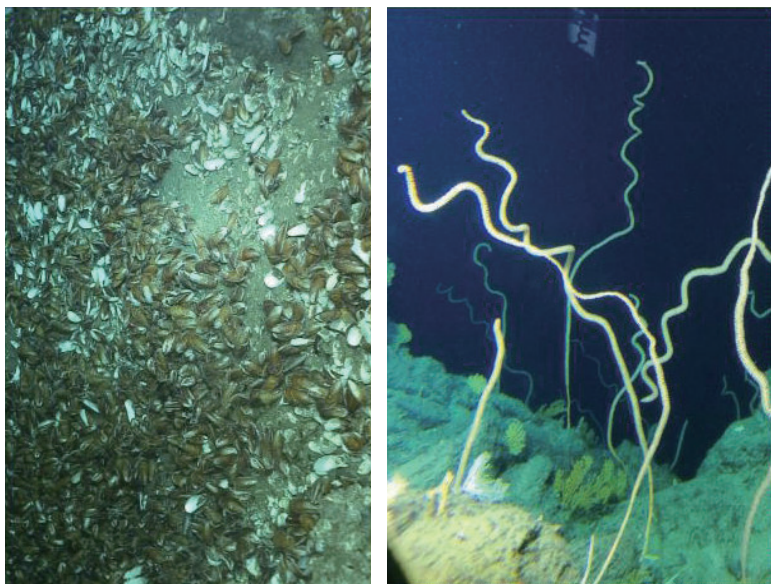
图2 冷泉贻贝群（左）和深水珊瑚林（右）

就是所谓的可燃冰。还有一种是深水的珊瑚林，这是西沙群岛的海底，1400米左右深吧（图2）。这个像鞭子一样的珊瑚，比人要高多了，如果把它拉直大概5米长，这么高的一根杆在海里面摇摇晃晃，吃“海雪”带来的微体小动物。这使我大开眼界，那次我出来后，记者追着我问看到了什么，我说爱丽丝漫游仙境啊，真的像仙境一样，因为我没想到海底有那么热闹。但是你想一想，这些东西永生永世在黑暗里面，深潜器不下去照亮它，没有人看得见。所以我告诉大家两个海洋，一个是你知道的海洋，一个是你不知道的海洋，今天主要讲后者。