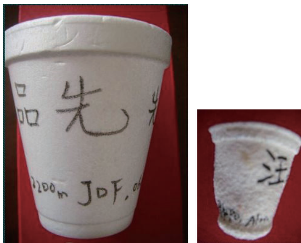
图3 被放入深海前后的泡沫杯子（左为之前，右为之后）

事很大很大的人才能做到的。到今天，日本和韩国还有海女这种古老的职业。深海的水压很大，这是我潜入深海前签好名的一个泡沫杯子，到了深海后就变成了这个样子（图3）。美国在1930年发明了一个金属的潜水球，人钻在那个球里，先下到200多米，后来下到了900多米，当时轰动了美国。后来瑞士的一个工程师也设计了一个深海潜艇，他让他的儿子跟一个美国军官下到了10000多米的马里亚纳海沟，世界上最深的地方，他们到海底待了20分钟就上来了。但是他们这个技术是只能上下、不会走动的，就是下去以后待了一会儿就上来了。而我们现在的“蛟龙号”“深海勇士号”是可以走的，这个差别很大。詹姆斯·卡梅隆是个电影导演，《泰坦尼克号》和《阿凡达》是他拍的，这个导演的业余爱好就是潜水。他集资打造了一个7米长的深潜器，2012年自己一个人下到马里亚纳海沟。2013年，中国也开始了“蛟龙号”科学应用航次。非常高兴的是，2013年“蛟龙号”第一次科学航次是同济大学周怀阳教授主持的，他下潜到了南海，后来又下潜到了西南印度洋。所以同济大学在这方面还是蛮风光的。