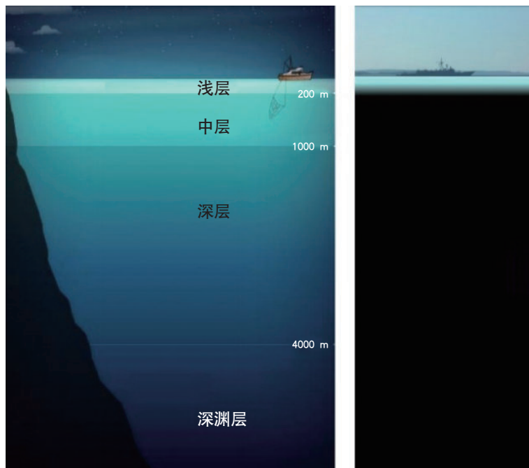
图1 海洋深处的两种表达

今年5月我参与了南海的深潜考察，感受很深。我坐着“深海勇士号”潜入海里，先看到的是气泡，然后就是“海雪”。海里面永远在“下雪”，其实就是大批死的和活的有机体向下掉。我第一次下潜到海底的时候，一个兴奋点就是碰上了深海生物群。这是两种生物群，一种是冷泉贻贝群，冷泉