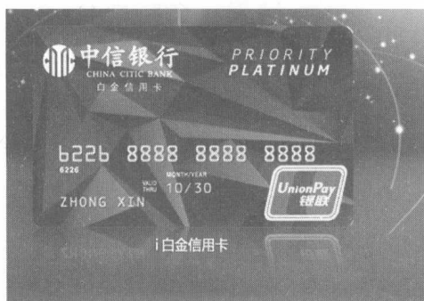
图1-7 中信银行i白金信用卡

图1-7所示为曾经风行一时的中信银行i白金信用卡，其特色权益就有大幅的缩水，开卡赠送的机场休息室特权已基本没有，原来附赠的1500万元航空意外险也降至500万元，机场延误险也需要满足一定刷卡条件才可使用。