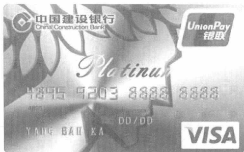
图 1-6 信用卡白金卡

白金卡属于高端信用卡，卡面多为银白色，上有英文字母“P”或英文单词“Platinum”，如图 1-6 所示。