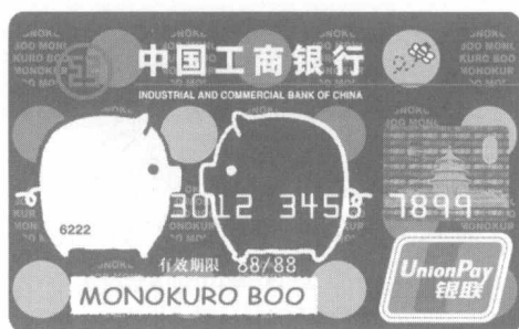
图 1-2 中国工商银行猪卡

用卡多是普卡。同时，普卡也是发行量最大，种类最多的一种信用卡，甚至曾出现过初始授信额度为10元的信用卡，如中国工商银行发行的猪卡，如图1-2所示。