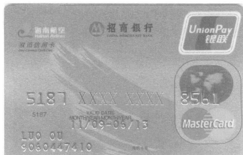
图 1-4 招商银行双币信用卡