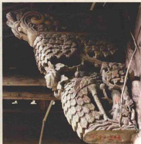
5. 史图博居住民居中的马腿图