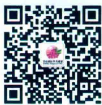
微信公众号二维码