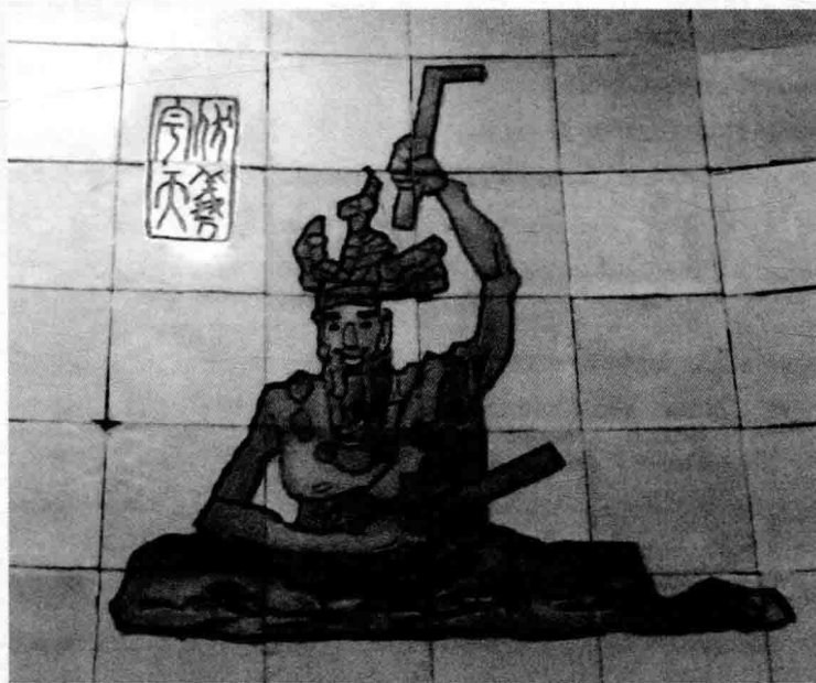
伏羲（中国农业博物馆展厅壁画）

【作者简介】 曹植（公元192—232年），字子建，曹操第三子。三国时期曹魏著名文学家，作为建安文学的代表人物之一与集大成者，在两晋南北朝时期，他被推尊到文章典范的地位。其代表作有《洛神赋》、《白马篇》、《七哀诗》等。后人因其文学上的造诣而将他与曹操、曹丕合称为“三曹”。