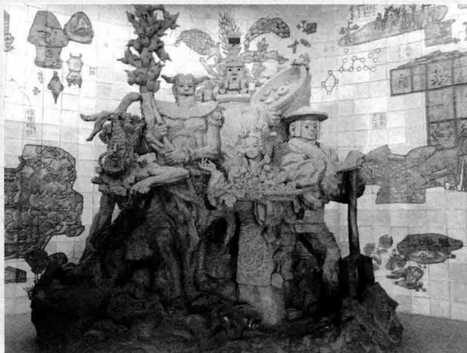
中华人文始祖（中国农业博物馆陈列雕塑）

伏羲、神农、黄帝、嫫祖、大禹被称为中华人文始祖。相传伏羲教民畜养六畜、发明渔网；神农尝百谷、教民稼穡；黄帝执掌天文历算、发明了医学；嫫祖教民育桑养蚕、纺纱织布；大禹教人开渠排水、疏通九河，中华民族在五位人文始祖的带领下，摆脱了洪荒时代的蒙昧，探索发明了新的生产手段和生活方式，奠定了中华民族早期的文明和深厚而牢固的文化根基。这尊“大地曙光”塑像，意喻在五位人文始祖的带领下，中华大地出现了文明的曙光。