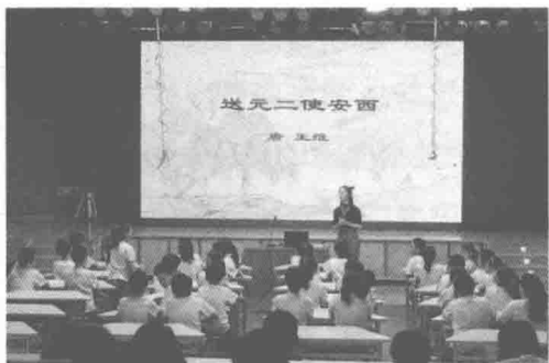
诗歌吟唱研究课程

2016年起，我们又与北京师范大学文学院“南山诗社”合作，为三、四年级的学生开设了“诗歌吟唱课程”。所谓“诗歌吟唱”，是挹取《碎金词谱》《九宫大成谱》等古谱的精华，并结合李叔同先生《学堂乐歌》以来今人的作曲成果，为诗词配曲，使一首首古奥雅驯的诗词更容易“融化”在孩子的口齿间，“融化”在孩子的心里。