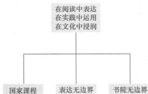
语文部“两级三层”课程示意图