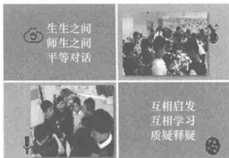
构建师生间真诚互动的课堂

试“组合阅读”“绘本阅读”，探索整本书的阅读；挖掘教材中篇章与篇章、单元与单元、年级与年级之间的联系，进行整合与取舍；实现学生阅读方法的迁移，阅读视野的拓展，思维品质的持续培养。感受中华文化的无穷魅力。教学中还倡导以“学习共同体”的构建促高效。力求继承中国传统书院自由开放的学习模式，激发学生的内驱力，为学生提供更多自修、讨论、表达、践行的机会，强调学生在学习中的主体地位，倡导生生之间、师生之间平等对话，互相启发、互相学习、质疑释疑，提高学生“感知、思考、交流”的愿望和能力。力求构建师生间真诚互动的课堂，相互“感应”的课堂，实现课堂上师生情志的共同生发。让课堂成为学生习得方法、内化语言、发展思维、外化表达的过程。