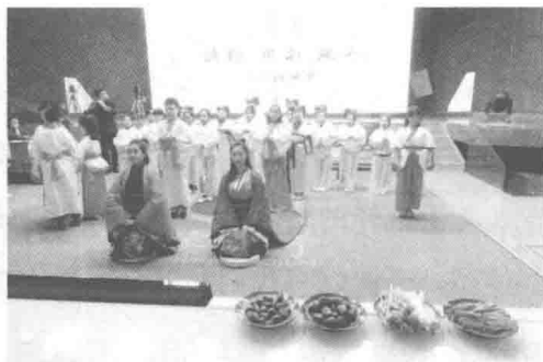
诗歌吟唱课程展示

为诗词配曲，强调诗词的音乐属性，是“诗教”的应有之义。王船山先生曾说：“教之以诗，而使咏歌焉者，何也？以学者之兴，兴于《诗》也。”——一个“兴”字，点出了“诗教”的灵魂所在。诗歌吟唱的课堂，不是“我教你学”、师生情感相隔的课堂，而是在吟唱声中，师生情志共同生发、兴起的课堂。在我们“诗歌吟唱”的课堂上常常出现这样的情形——老师问：“我们曾经学过许多与春天有关的诗，大家还记得吗？”不知谁起了头，一人唱之，众人随之，一首唱罢，第二首又立刻接上……诗句的韵律、诗歌的内涵就是在这样轻松、浪漫的情境里被孩子直觉地感知到；文化的因子，就是这样自然而然地浸润到孩子的心里。