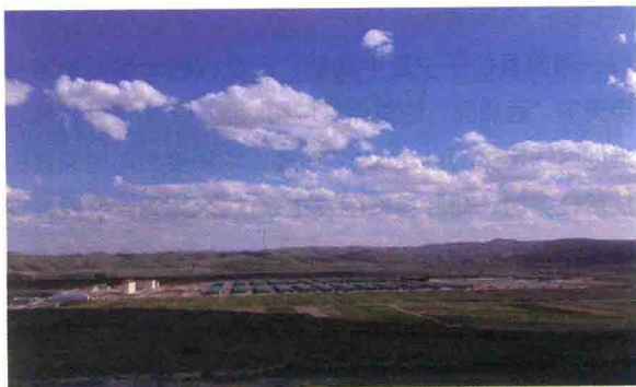
图 1 海原草畜一体化肉牛养殖基地①

在海原县政府紧密配合下，华润选取 150 户不具备养殖条件的极端贫困户作为试点。这 150 户极端贫困户，有 100 户是因病、因残、老弱孤寡缺乏劳动能力的家庭，有 50 户是安于现状脱贫内生动力不足的家庭。针对这些极端贫困农户的情况，华润计划通过“基础母牛银行 + 托管代养”模式帮助他们摆脱贫困。按照托管代养模式，每户极端贫困户认养 3 头基础母牛，基础母牛由养殖基地代为饲养，3 头基础母牛的购置费用由农户自筹资金 6,000 元，政府补贴 6,000 元，“基础母牛银行”赊销贷款 18,000 元，合计 30,000 元。经测算，3 头母牛通过自身增值和产犊 3 年共可产生 8,000 元收益，3 年合作期内华润将农户自筹资金 6,000 元、扶贫款项 6,000 元和产生效益 8,000 元，共 20,000 元分三年返还，即第一年为每户支付 6,000 元，第二、第三年每年支付 7,000 元。通过这种帮扶模式，政府 6,000 元的扶贫资金在三年内增值为 14,000 元，150 户极端贫困户三年内的生活将得到基本保障。