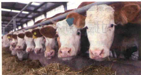
图3 海原草畜一体化肉牛养殖基地③