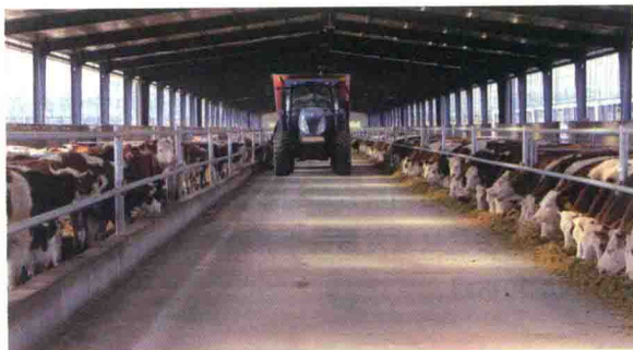
图 2 海原草畜一体化肉牛养殖基地②