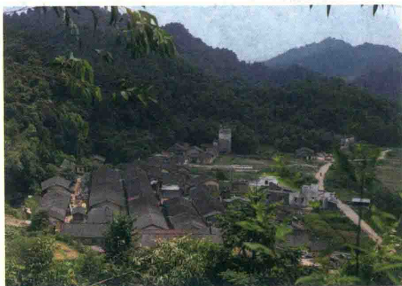
图 1 树山村改造前

四是全国 9 省 14 县全面推进阶段。 党的十九大描绘了决胜全面建成小康社会、夺取新时代中国特色社会主义伟大胜利的宏伟蓝图。集团决心以更大力度投身到精准扶贫和乡村振兴的伟大事业中。2018 年起，把扶