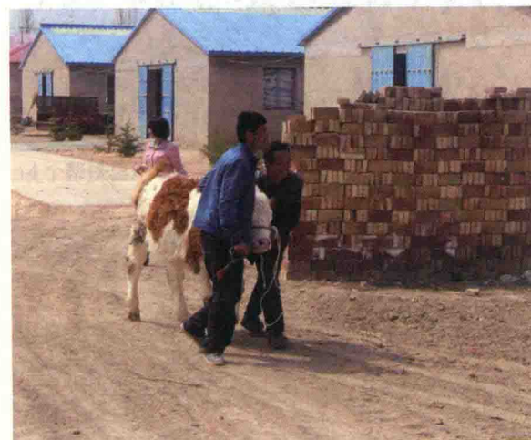
图5 农户牵回赊销的基础母牛