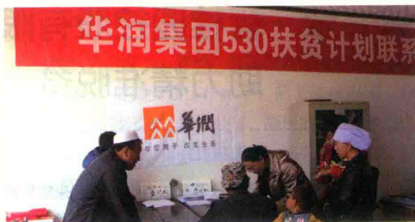
图6 农户在签订赊销协议