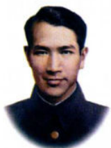
冼星海 (1905—1945) 中国作曲家