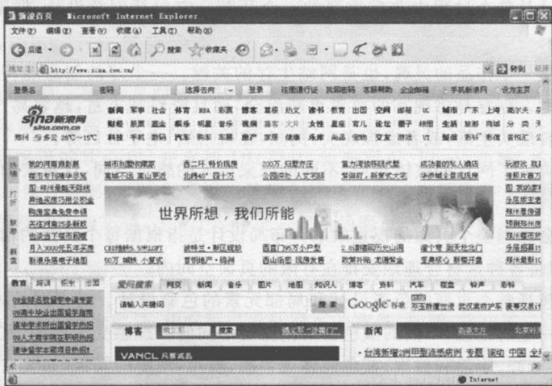
图 1-1 新浪主页

主页(Homepage)是进入 WWW 网站的第一页,也称为首页。主页与一般网页不同之处在于,是各个子网页的集合,是进入该网站其他网页的“入口”。通过主页上的介绍或说明,用户可以在短时间内了解该网站所提供的信息和服务项目。主页总是和一个网址(URL)相对应,可带领用户走进一个网站。例如,网站 http://www.sina.com.cn 的主页如图 1-1 所示。