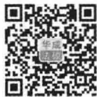
华成法硕微信二维码, 扫描加关注