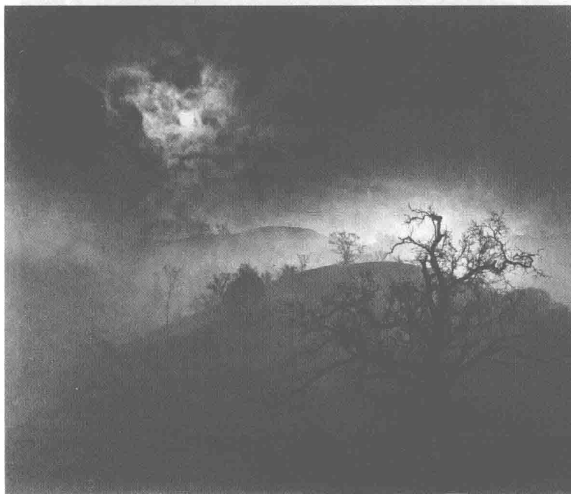
布洛克—潮汐水塘 1956 布洛克—荒涼的树 1956