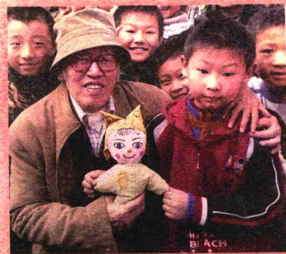
▲ 小读者的妈妈给孙爷爷做的小布头