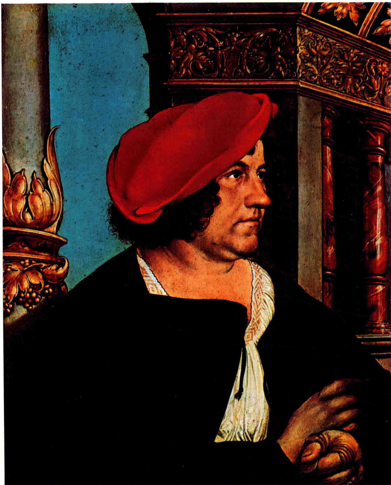
雅各布·迈尔肖像 1516年 木板 油画 38.5cm×30.8cm