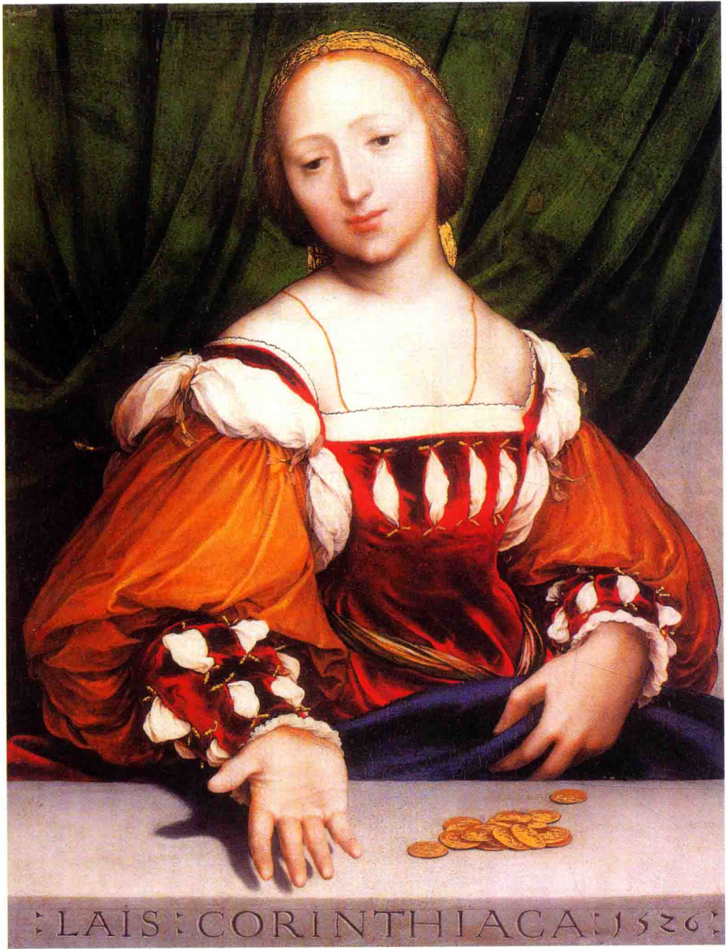
科林斯的莱丝 1526年 椴木板 油画 34.6cm×26.8cm