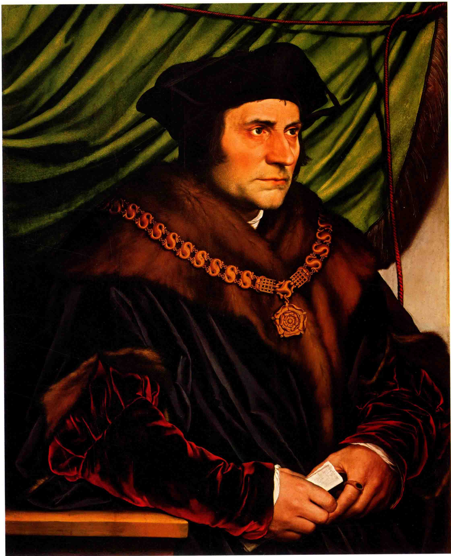
托马斯·莫尔爵士肖像 1527年 木板 油画 74.9cm×60.3cm