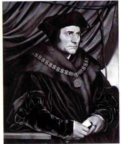
托马斯·莫尔爵士肖像

荷尔拜因是肖像画艺术的集大成者，在肖像画上的艺术成就奠定了他在西方艺术史中的地位。同样是因为肖像画，他受到英国贵族和宫廷，特别是深受英王亨利八世的垂爱，因而在英国站稳了脚步，开启了肖像画的艺术生涯。画如其人，细微精密、清逸淡雅的绘画艺术风格是荷尔拜因本人朴实无华、严谨、清淡平和气质的写照。