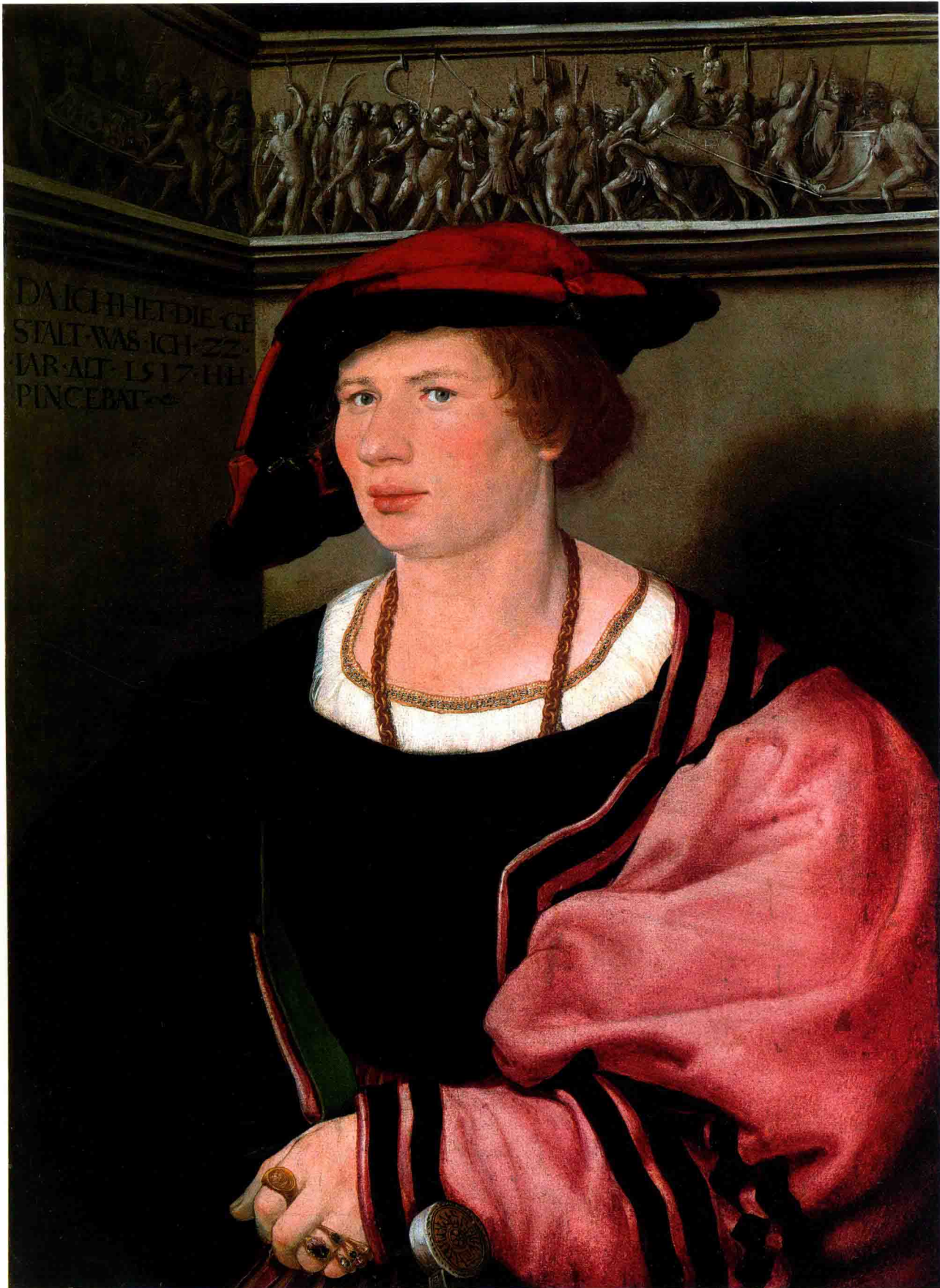
贝尼迪克特·冯·赫滕斯特的肖像 1517年 木板纸面 油画 52.4cm×38.1cm