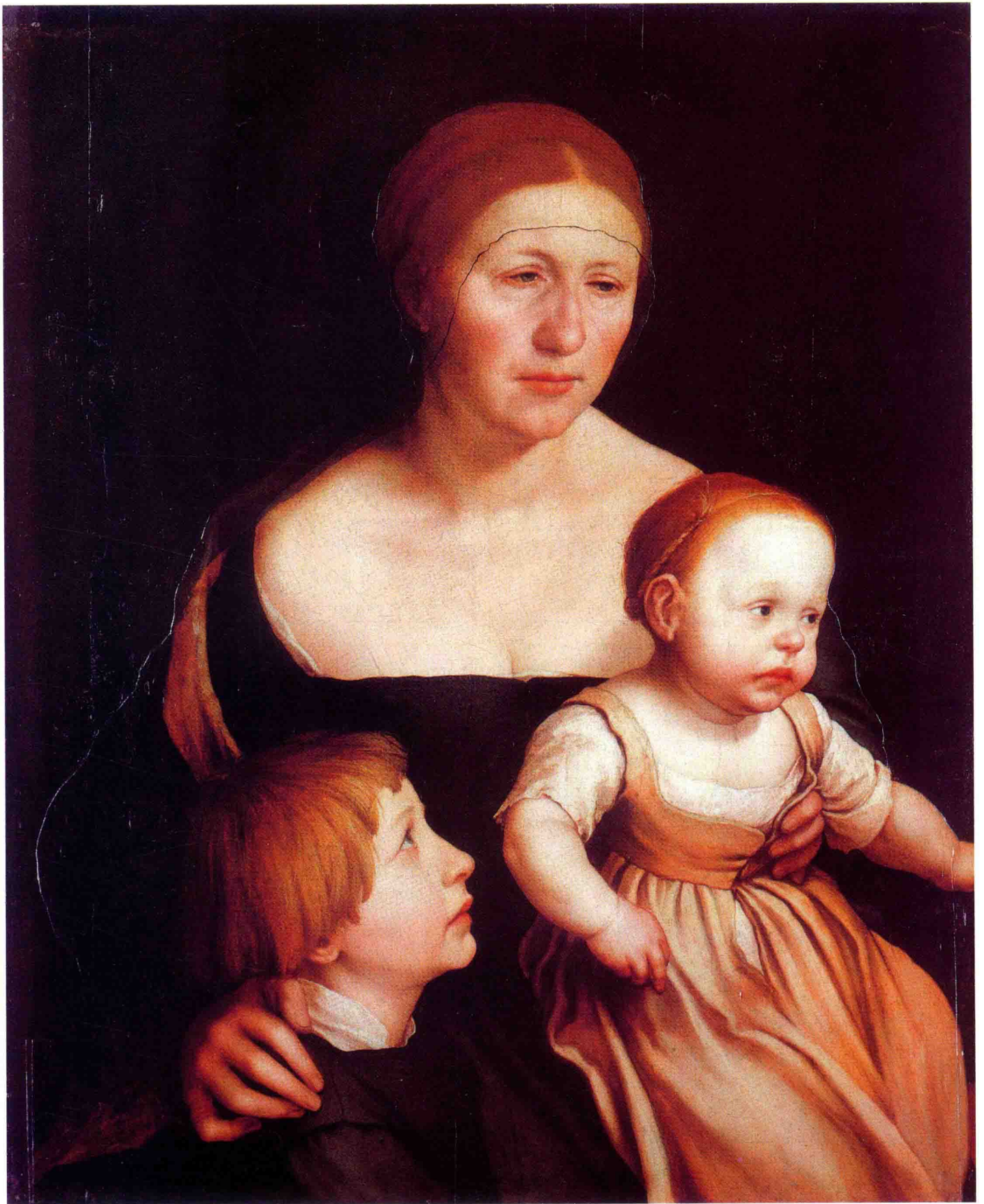
艺术家的家庭 1528年 纸上 油画 77cm×64cm