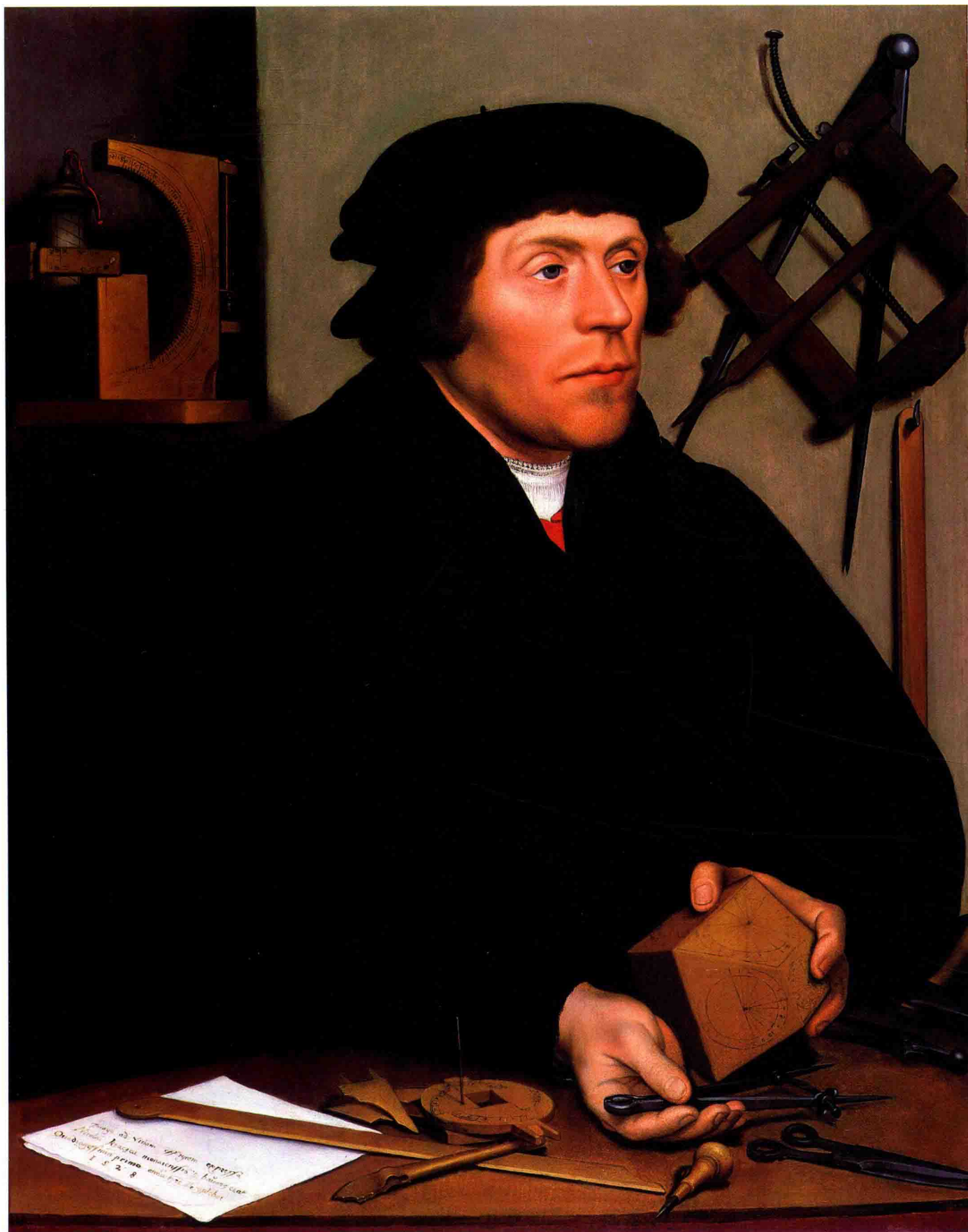
尼古拉斯·克拉泽肖像 1528年 橡木板 蛋彩画 83cm×67cm (局部右页)