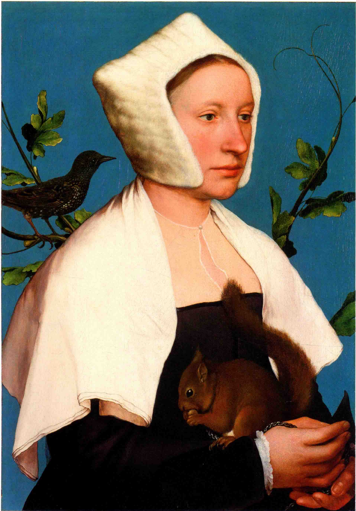
玛格丽特·吉格斯肖像 约1527年 木板 油画 37.9 cm × 26.9 cm