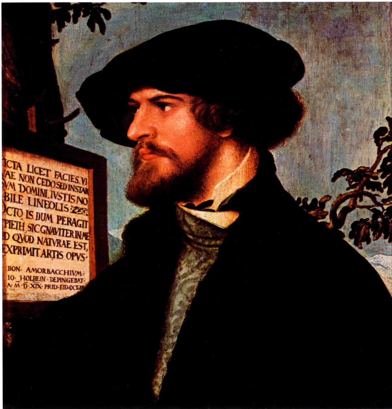
博尼菲修斯·阿默尔巴赫肖像 1519年 木板 油画 28.5cm×27.5cm