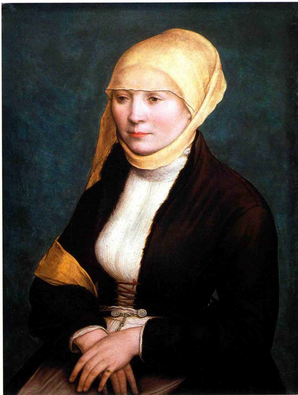
艺术家的夫人 约1517年 木板蛋彩画 45cm×34cm