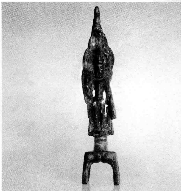
北齐铜鎏金菩萨像

独到见解，虽然有些见解不免有失偏颇，但其中不乏真知灼见。比如在《文章》篇，作者明确反对滥用典故、华而不实的文风，和后来唐宋“古文运动”的精神有异曲同工之处。再比如《音辞》篇中用发展的观点，列举大量的事实，旁征博引，第一次提出了语言的差异性，因而成为我国语言研究史上的重要文献。