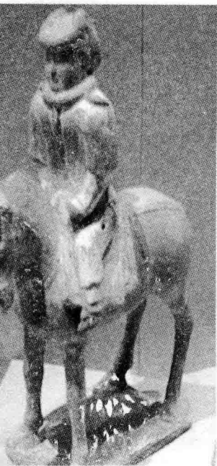
北齐灰陶彩绘骑马俑

文章、书法、弹琴、博弈、绘画、算术、卜筮、医学、习射、投壶等，这些技艺在生活中有实用意义，也有个人保健、娱乐的价值。但这些“杂艺”“可以兼明，不可以专业”。