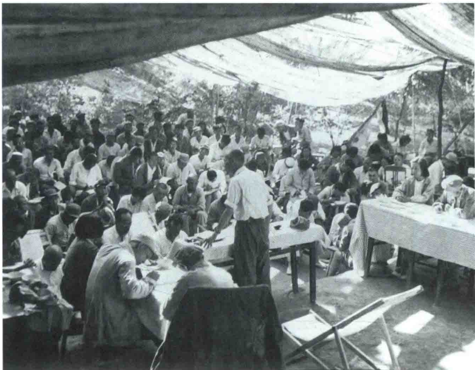
▶ 1947年，河北平山县西柏坡村召开中共全国土地会议，会议通过了《中国土地法大纲》。

1950年6月，中央人民政府委员会通过了《中华人民共和国土地改革法》。这部法律总结了中国共产党过去领导土地改革的历史经验，适应新中国成立后的新形势，成为指导新解放区土地改革的基本法律依据。