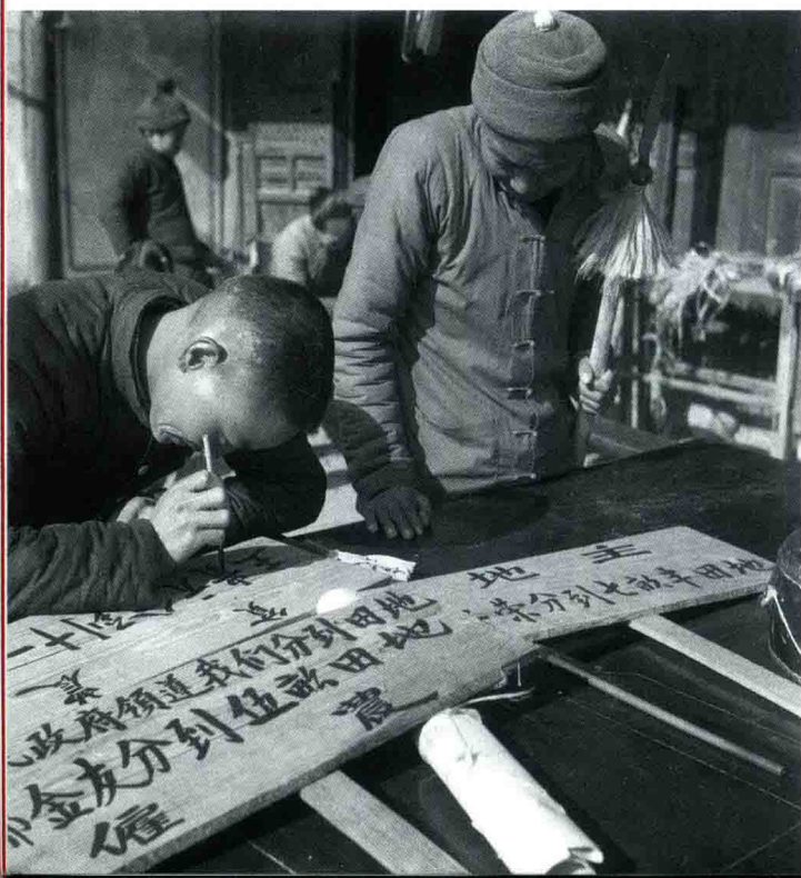
◀ 1950年12月，土地改革分完土地后，农民们正在写土地分界碑，准备插到地里去作标识。