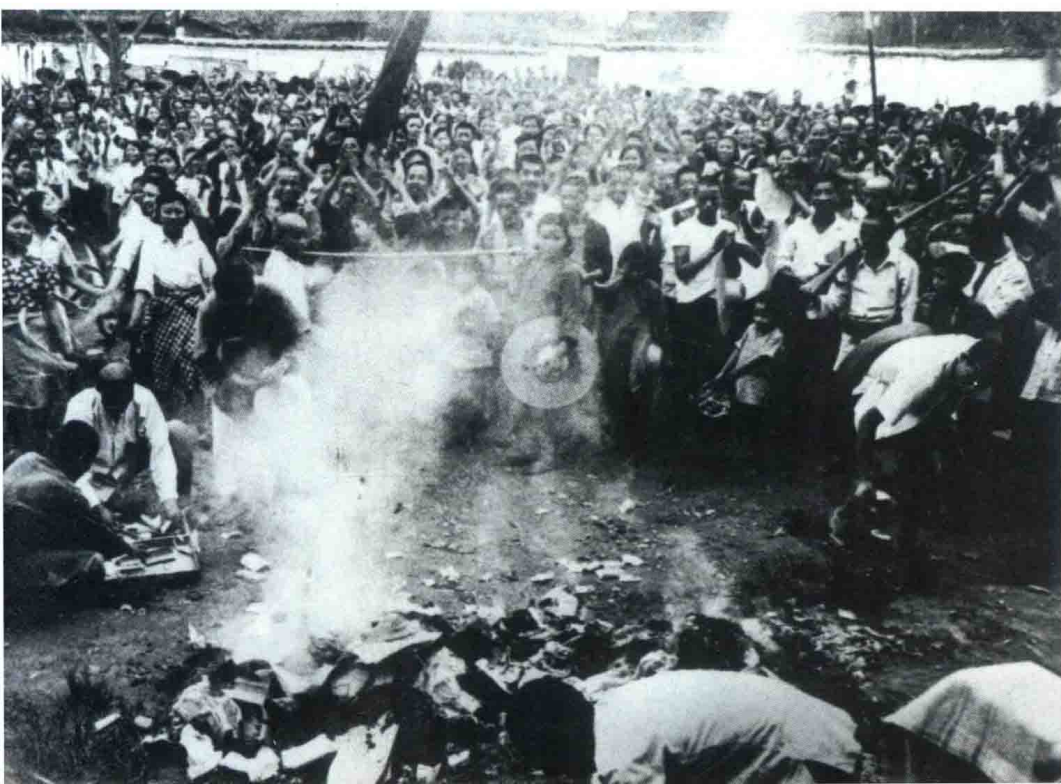
◀ 1951年6月5日，四川省合川县南津乡农民焚烧地主的土地契约书，庆祝土改胜利。