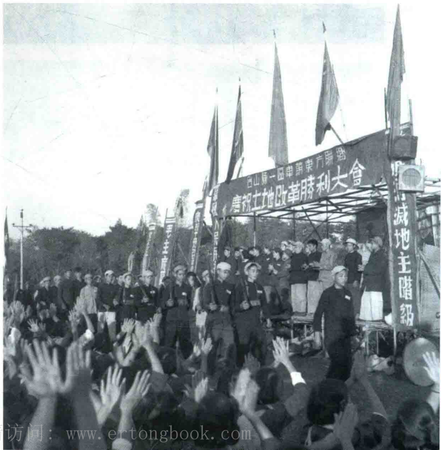
▶ 1953年，广东省台山县一区车萌东方联乡土地改革胜利完成大会上，民兵们在农民群众的欢呼声中，行经主席台前。（三联稿）

土改后，农村的面貌焕然一新。到1952年底，全国除一部分少数民族地区及台湾地区外，广大新解放区的土地改革基本完成。全国有3亿多无地少地的农民（包括老解放区农民在内）无偿地获得了约7亿亩土地和大量生产资料，免除了过去每年要向地主缴纳约3000万吨粮食的苛重地租。土地改革的完成，消灭了地主阶级封建剥削的土地所有制，从根本上铲除了中国封建制度的根基，带来了农村生产力的解放、农民生产积极性的提高、农业的迅速恢复和发展。这是近代以来中国人民反封建斗争的一个历史性胜利。