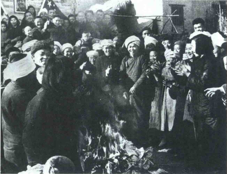
◀ 1951年9月，湖南省岳阳县策口乡的农民将旧地契丢入火中。（新华社发）

土改后，农村的面貌焕然一新。到1952年底，全国除一部分少数民族地区及台湾地区外，广大新解放区的土地改革基本完成。全国有3亿多无地少地的农民（包括老解放区农民在内）无偿地获得了约7亿亩土地和大量生产资料，免除了过去每年要向地主缴纳约3000万吨粮食的苛重地租。土地改革的完成，消灭了地主阶级封建剥削的土地所有制，从根本上铲除了中国封建制度的根基，带来了农村生产力的解放、农民生产积极性的提高、农业的迅速恢复和发展。这是近代以来中国人民反封建斗争的一个历史性胜利。