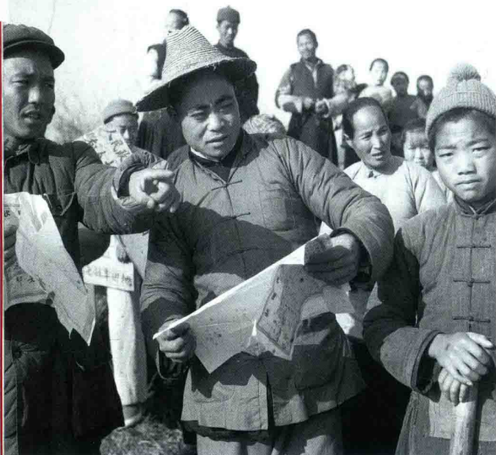
◀ 1950年，浙江省杭县临平区土改工作队的工作人员（左）带领农民进行分田。（资料照片）

从中央到地方都抽调大批干部组织土改工作队，其中吸收了相当一批新解放城市的青年和学生，经过集中培训，认真学习土改法令，掌握各项政策和工作方法，分期分批下到农村开展土地改革。从1950年冬季开始，一场历史上空前规模的土地改革运动，在新解放区有领导、有步骤、分阶段地展开了。