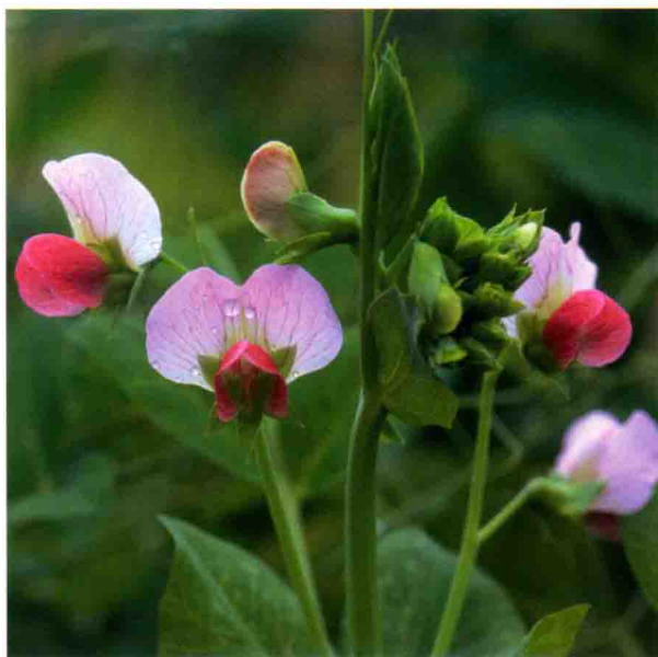
豌豆花外表娇嫩、颜色鲜艳，许多蔬菜也很漂亮、吸引人，根本不输于花园里面的观赏花。

我在这本书中无意强调有机食物的生产工艺。但我始终认为任何对食物比较“挑剔”的人都会极力避免给蔬菜施用化肥和农药。不管你喜欢有机食物还是普通食物，至少当你自己种植时，一切决定权在你。毕竟除了你，别人无法给你的蔬菜施用化学物质。