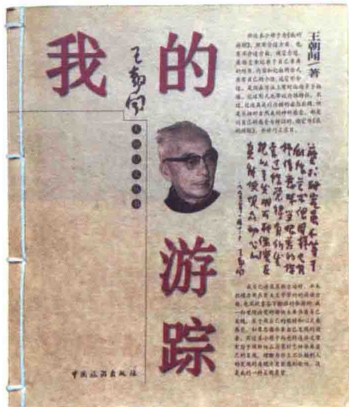
◎ 《我的游踪》2005年再版书影