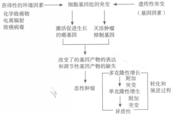
图 1-1 肿瘤的病因和发病机制模式图

肿瘤病因学研究引起肿瘤的始动因素，肿瘤发病学则研究肿瘤的发病机制与肿瘤发生的条件。要治愈肿瘤和预防肿瘤的发生，关键问题是查明肿瘤的病因及其发病机制。关于肿瘤的病因学和发病学，多年来进行了广泛的研究，虽然至今尚未完全阐明，但近年来由于分子生物学的迅速发展，特别是对癌基因和肿瘤抑制基因的研究，已经初步揭示了某些肿瘤的病因与发病机制，如 Burkitt's 淋巴瘤和人类 T 细胞白血病/淋巴瘤等。目前的研究表明，肿瘤从本质上说是基因病。引起遗传物质 DNA 损害（突变）的各种环境的与遗传的致癌因子可能以协同的或者序贯的方式，激活癌基因和（或）灭活肿瘤的抑制基因，使细胞发生转化（transformation）。被转化的细胞可先呈多克隆性增生，经过一个漫长的多阶段的演进过程（progression），其中一个克隆可相对无限制地扩增，通过附加突变，选择性地形成具有不同特点的亚克隆（异质性），从而获得浸润和转移的能力（恶性转化），形成恶性肿瘤。图 1-1 示肿瘤的病因和发病机制模式。