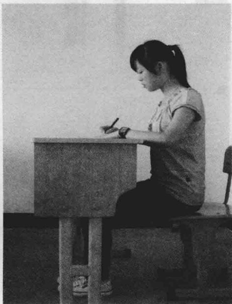
图 2-2 写字正确坐姿

端正写字的坐姿有三个方面的意义:第一,正确的坐姿能使眼睛与桌面保持适当的距离,这样可以对书写者的视力起到保护的作用;第二,正确的姿势使骨骼处于合理放松的状态,可以缓解疲劳,尤其是对正在成长发育的青少年的骨骼健康起保护防范作用;第三,端庄的写字姿势可以端正书写者的身心及写字的态度。