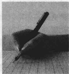
图 2-1 执笔手势

毛笔需要笔杆保持垂直,这样便于中锋行笔。相比较而言,硬笔则没有毛笔较长的锋颖,笔尖短且坚硬,所以在执笔时,笔杆应当呈斜状,其角度以约 45^{\circ} 为宜。(见图 2-1)